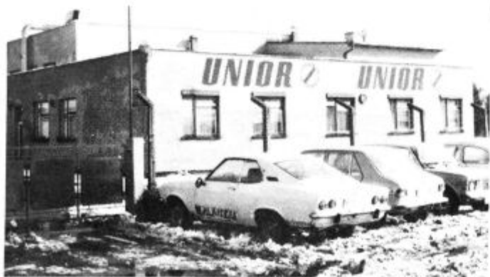
Svetleče Uniorjevo ime na pročelju upravne zgradbe TOZD-a Orodje Lenart je garancija za kakovost. Ko bi le uresničili predvidene načrte, ki so jih začasno zavrlj ukrepi zvezne vlade.

V podrobnem elaboratu za proizvodnjo plastike so v TOZD Orodje predvideli velik tehnološki skok na tem področju. Veljal naj bi okrog