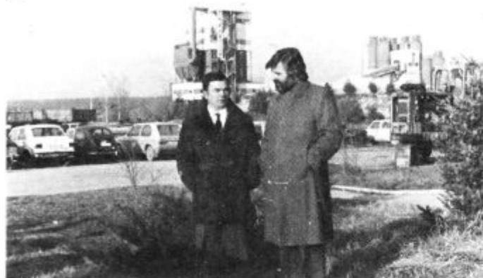
Dva zamišljena direktorja — iz Centrovoda in Podravine Durdevac — dva resna obraza. Le o čem razmišljata — morda o zares obetavni prihodnosti?

Nedorečenost mnogih ukrepov, v glavnem tistih, ki jih uveljavlja Zvezni izvršni svet, vnaša v poslovno politiko večine organizacij združenega dela negotovost. Smeli koraki v nove naložbe so tako redkost, ki ji treba nameniti posebno pozornost. V Centrovodu so zasnovali širitev na način, ki je za lenarške razmere nov; v TOZD Orodje zreškega Uniorja so prav omenjeni ukrepi tisti, ki še vnašajo negotovost, vendar je nov tehnološki skok z novim proizvodnim programom precej obetaven; obnovljena, pravzaprav nova tehnološka linija v TOZD Proizvodnja boilerjev pa bo ob mnogo višji kakovosti izdelkov prinesla še druge prednosti.