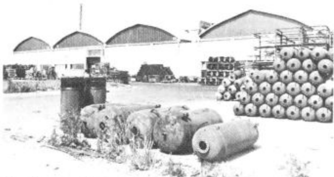
Odpadle vode iz TVT Boris Kidrič pri Lenartu ne bodo več onesnaževale okolja. Posnemanje vredna poteza v prizadevanjih za čisto in zdravo okolje.