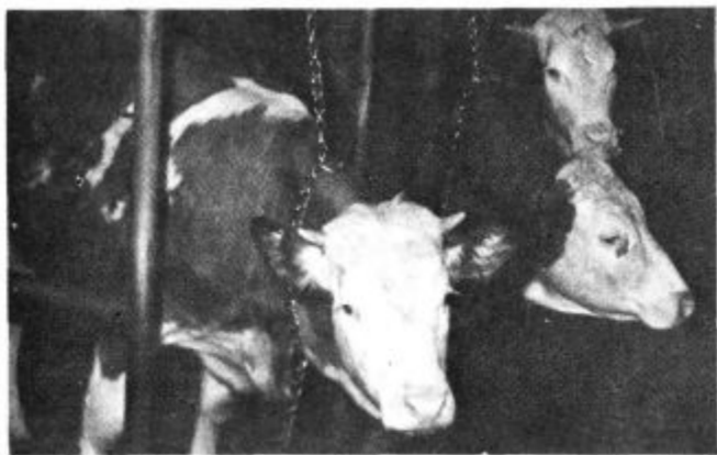
Tudi krave začudeno po svoje razmišljajo o naši zares čudni kmetijski politiki.