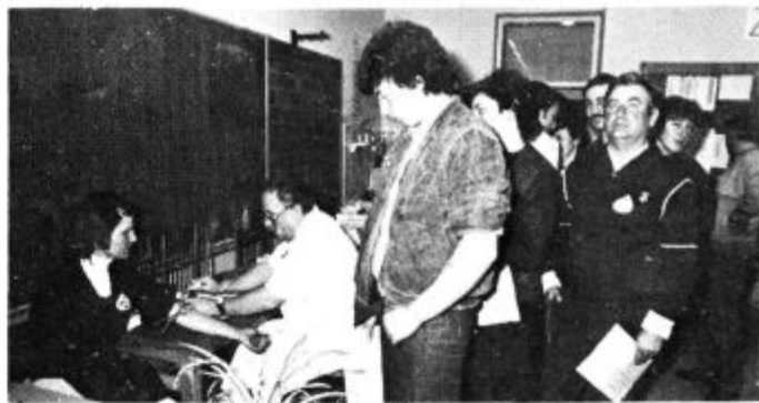
Leta 1986 so bili pri nas 1304 krvodajalci. Le tako naprej.