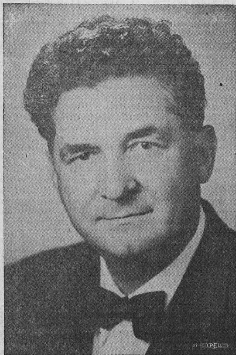
FRANK J. LAUSCHE