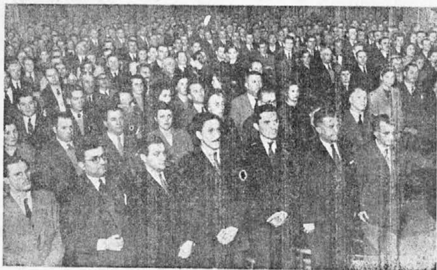
Pogled na predstavnike in občinstvo ob otvoritvi Mladinskega Kongresa

žili na spomenik krasen venec. Prisostvovali so pri polaganju venca zastopniki Kongresa in veliko število mladine in rojakov.