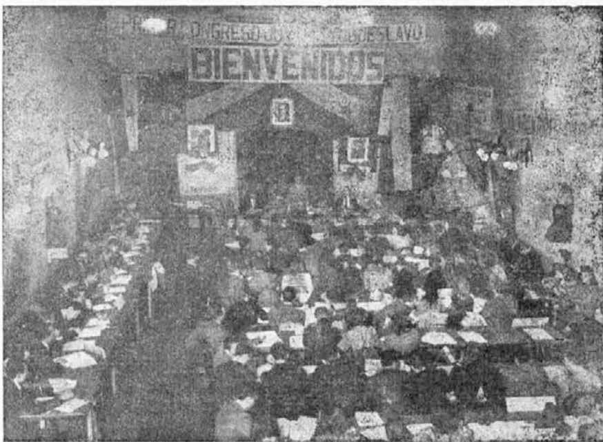
Pogled na dvorano ob zasedanju Mladinskega Kongresa

ski kazni in se med nami nahajajo, z namenom sejati razdor in nezadovoljstvo med našo naselbino. 38) Sklenemo pridružiti se resoluciji Prve Jugosl. Konference, ki se je vršila 4. in 5. maja t. l., v pogledu praznovanja jugoslovanskih in argentinskih narodnih praznikov.