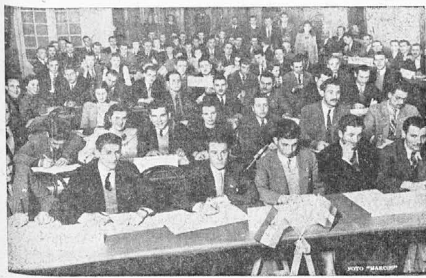
Delegati na Mladinskem Kongresu

besedilo in uglasiti "Koračnico Jug. mladine v Argentini". 16) Priporočati vsem mlad. odsekom podpirati in sodelovati pri kampanji za obnovo Jugoslavije. 17) Gojiti šport v vseh mlad. odsekih, ustanavljati razne športne ekipe, medsebojno tekmovati kakor tudi z raznimi ustanovami, katere bi F. J. M. v tem oziru vabila.