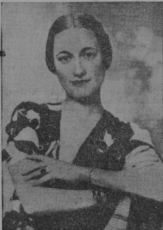
Angleški kralj Edvard VIII. je odstopil radi dvakrat ločene gospe Simpson, katero vidimo na sliki.

valinami in iščejo svojce. Ranjence so odvažali na ladjah, ker jih niso mogli nikjer v mestu samem nastaniti. Iz vasi po okoličici Adane so si oteli vaščani s pobegom golo življenje. Vse ceste, telefonske zveze in mostovi so porušeni. Pretresljivi prizori so se odigravali v dečjem zavetišču ob reki Sesun. Poslopje so valovi trenutno zajeli od vseh strani. V obupu so otroci poskakali v vodo, ki jih je odnesla. Predsednik Turčije Kemal Ataturk je prispel