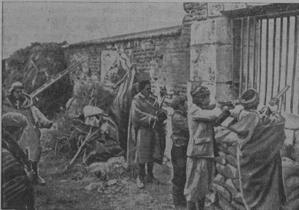
Maroške čete v bojih z rdečimi pri Casa del Campo v Španiji.