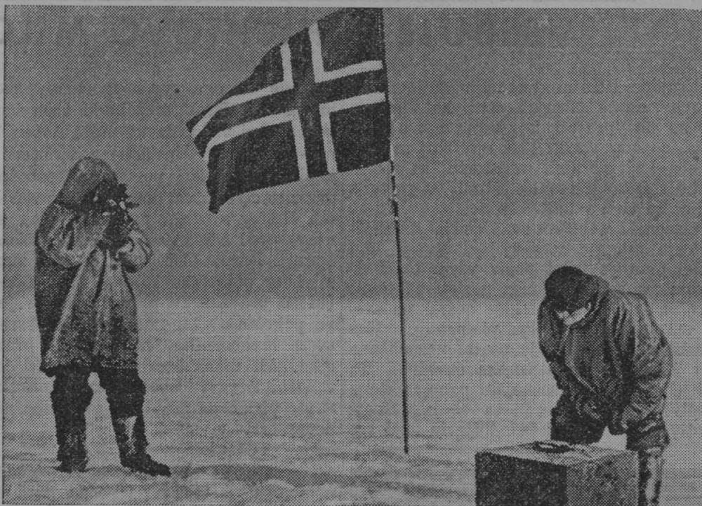
Norveški raziskovalec Roald Amundsen je kot prvi dosegel južni tečaj 14. decembra 1911. Slika nam kaže razvitje norveške zastave na južnem tečaju.