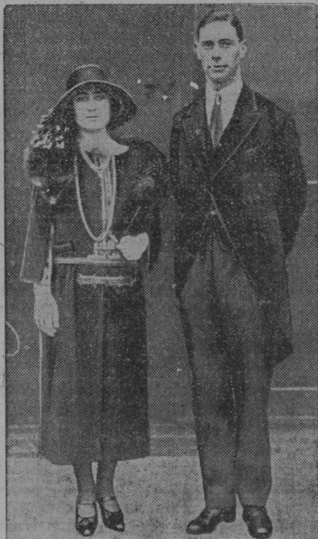
Novi angleški kralj Jurij VI. in njegova soproga Elizabeta.

kmalu na kraj nesreče, kjer je sam vodil reševalna dela s pomočjo vojaštva in Rdečega križa.