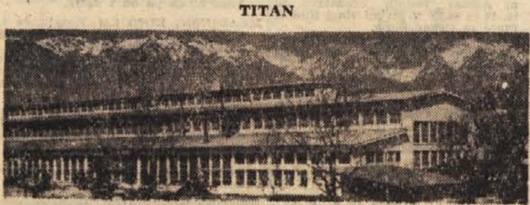
Kjer je bil pred 60 leti še skromen mlinček in nato obrtniško in polindustrijsko podjetje, se sedaj vedno bolj širi moderni industrijski gigant — tovarna kovinskih izdelkov in livarna »TITAN« v Kamniku

Podjetje ima pripravljene investicijske načrte za mehanizacijo izkoriščanja kamenine kalcit ter za pralnico (separacijo) livarskega peska v Moravčah. 8 temi investicijami se bo brutoizdatki podjetja povečali za nadaljnjih 50 milijonov dinarjev, tržnice bo pa tako dobilo še razne nove proizvode.