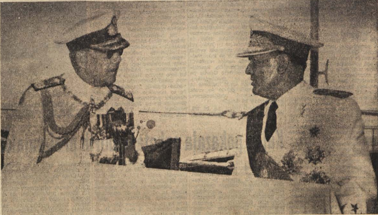
Predsednik republike Josip Broz Tito in grški kralj Pavel v prijateljskem razgovoru