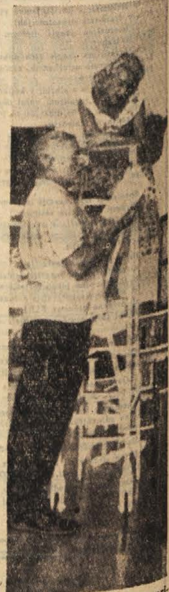
Ernest Hemingway, znani ameriški pisatelj — menda bo nastopil v stranski vlogi v filmu, ki ga bodo posneli po njegovih nagradnih noveli »Starec in morje« — ni nič kaj navdušen za obiskovalce na svojem posestvu pri Havanni na Kubi. Castna izjema je bila po vsem videzu francoska filmska igralka Martine Carol, ki se je na svojem potovanju okoli sveta ustavila tudi na Kubi, kjer ji je pisatelj rad pokazal dragocenosti svoje knjižnice, kot kaže naša slika.