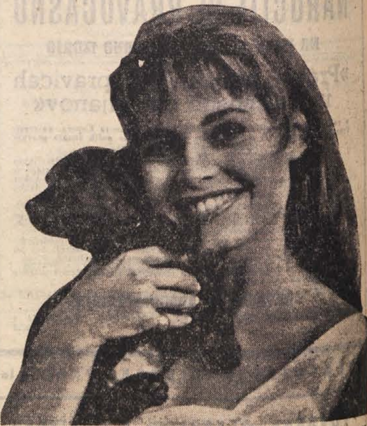
Nedavno je 22-letna francoska igralka Brigitte Bardot nastopila v filmu »Sla po ljubezni«. Skupno z Rogerjem Pigautom in Raymondom Pellegrinom je tvorila v psihološki drami ljubezenski trikotnik. — Zdaj snema Brigitte Bardot v režiji svojega moža Rogerja Vadima že sedemnajsti film.

Potem ko se piščanček razvije, je tudi že dovolj močan, da z apnenčasto konicico svojega kljuna prebije jajčno lupino — vedno na najtanjšem mestu, to pa je na debelem koncu jajca — in se tako reši lupine, ki mu je s svojo vsebino dajala hrano, potem pa se je spremenila v ječo mladega zastopnika določene vrste.