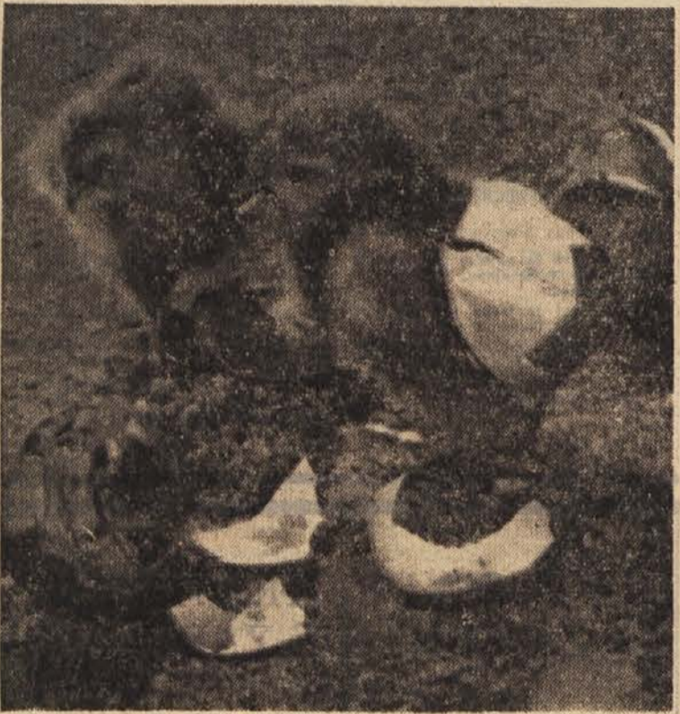
Eden se še ni povsem rešil oklepa, ki mu je navsezadnje postal odveč

Kokošji zarodek po 36 urah. Sistema živčevja in prebavil sta zasnovana, prav tako hrbtnica z vretenci. Tudi srce že začne utripati.