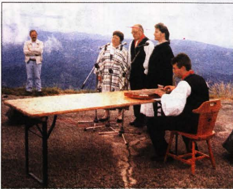
Tri momenti praznika: pozdrav prijateljem na varhu Matajura, zbor od CAI iz Čedada an pevska skupina Dednina iz Tolmina