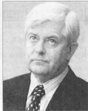
Predsednik Milan Kučan

Predsedniške volitve odpirajo vrsto političnih vprašanj, saj se marsikdo že sprašuje, kakšna bo bodoča vloga zdajšnjega predsednika v slovenski politiki. Ne nazadnje pa je treba k temu razmišljanju izpostaviti tudi nekatere možne zamenjave znotraj vlade in dejstvo, da bo vstop Slovenije v Evropo