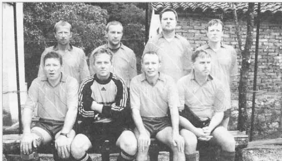
La formazione di Stregna che ha concluso il torneo al quarto posto

si è giocato un triangolare tra le squadre femminili di Grimacco, Oborza e Torreano. Grimacco ha superato per 2-1 Oborza, la quale ha a sua volta avuto