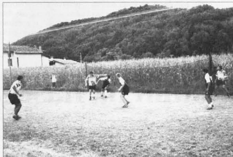
Una fase della gara giocata tra B.C.B. e La Cascina

Il campetto di Correda di S. Pietro al Natisone ha ospitato la scorsa settimana il 1° torneo di calcetto a quattro, organizzato dai giovani locali con il supporto della Pro Clenia.