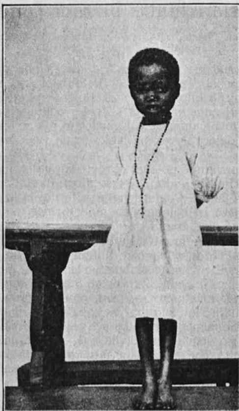
Zamorska sirota, katero so vzgojili v misijonu.