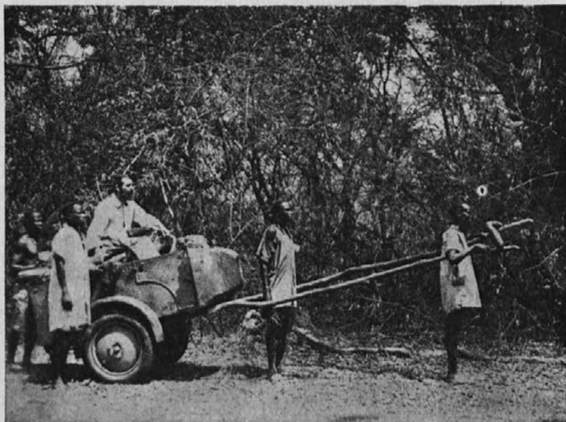
S takim vozom pride misijonar preko voda in močvirja.

Tako je minul prvi del družbe »Malih sester« in se začel drugi. Pred nekaj tedni so štiri sestre napravile večne obljube. To so prve sestre, ki so pred 15 leti prišle k nam še v svojih otroških khaki-oblekcah, prepasane z usnjatim pasom in z rožnim vencem. Slovesnost se je izvršila v naši ljubi kapelici, ki smo jo postavili tudi s po-