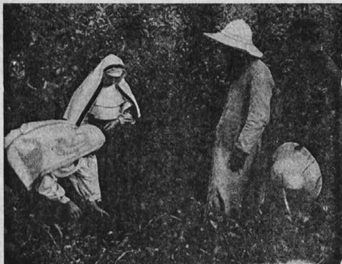
Našli so v gozdu majhno dete poleg mrtve matere.

(100 funtov), bi se vse obrnilo na bolje. Šele eno leto smo tukaj, vsak začetek je težak, povsod vsega manjka: v cerkvi, šoli in pri gospodarstvu. Da bi le prišli ven iz prvih stisk, pozneje ne bo več toliko izdatkov.