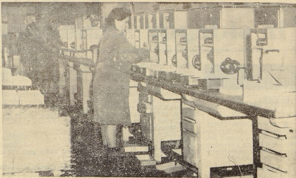
Po dolgem odmoru je kamera našega reporterja spet zabeležila posnetek iz proizvodnje usmerniških naprav v Novem mestu

Lani se je v tovarni usmerniških naprav v Novem mestu znova spremenilo razmerje med serijsko proizvodnjo in izpolnjevanjem individualnih naročil in sicer tako, da je serijska proizvodnja morala zajemala 30%, ostala pa 70%. Pri tem so se jasno povečale potrebe po uslugah ZZA in stroški za to dejavnost, vendar je prav tu pogosteje prihajajo do največjih problemov. Na eni strani so kratki dobavni roki s strani kupcev priganjali proizvodnjo, leta pa zaradi nepopolne tehnične dokumentacije s strani ZZA vselej ni uspela dohiti postavljenih rokov. Glede na takšno proizvodno strukturo bi bilo na tem področju treba doseči ugodnejše sodelovanje, saj je od tega močno odvisna nadaljnja rast tovarne v Novem mestu, v kateri je treba doseči tudi to, da bodo izkoriščene vse njene razpoložljive zmogljivosti.