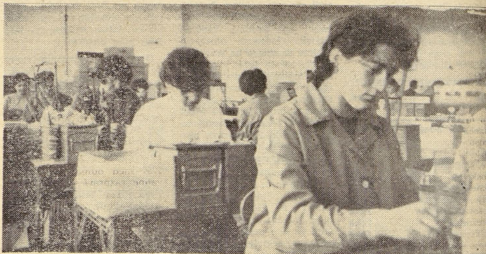
Iz montažnega oddelka televizorjev RIZ v Slunju

13,7%, pri dohodku pa skupno 5,8%. Čeprav je realiziran padec skupnega dohodka za 13,7%, je dohodek kljub temu zmanjšan za 5,8%, kar dokazuje pozitiven vpliv vzporedne rasti stroškov