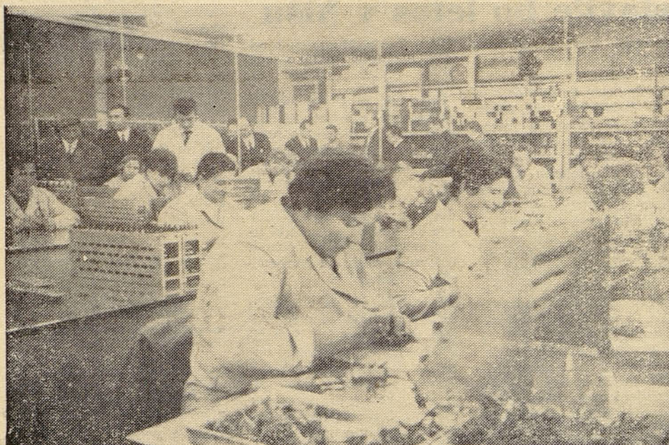
RIZ Zagreb: posnetek iz delovne enote visokofrekvenčne telefonije