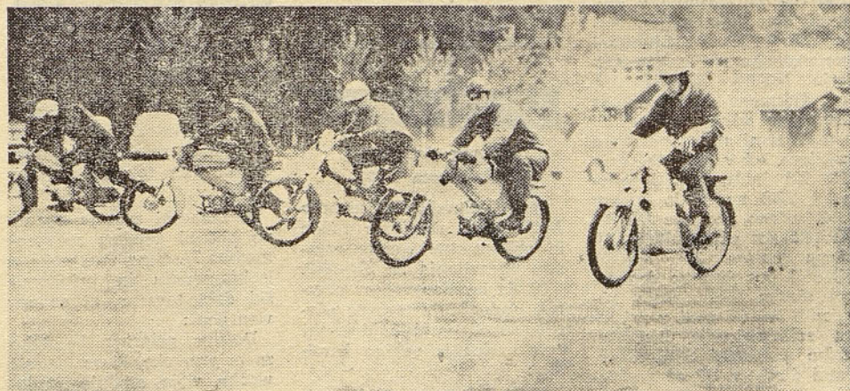
KDO BO HITREJSI?... Kolektiv »Avtomatika« prireja že nekaj let dirke z mopedi. Letos bo start 30. aprila ob 13. uri izpred tovarne »Avtomatika« Pržan pri Ljubljani. K tekmovanju vabijo dobre mopediste iz vseh organizacij ISKRA

Kranj, Savska loka 4 Tel. 22-221, int. 333.