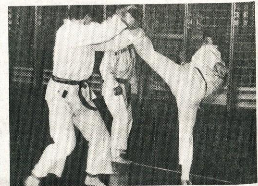
Borbeni trenutek z ene od tekem domžalskih karateistov.

Obem ekipam želimo v tekmovalni sezoni 1989/1990 čimboljšo uvrstitev in veliko tekmovalnih uspehov. O rezultatih posameznih kol bomo redno obveščali. M. K.