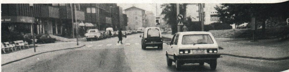
Kje ste črte? V prihajajočih vse temnejših dnevih na marsikateri cesti pogrešamo obnovljene talne oznake. Črte po sredini robovih cest bi nam pomagale varno voziti tudi v izjemno težavnih zimskih razmerah.

LB — BANKA DOMŽALE S tem odgovorom se strinja Svet varčevalcev LB — Banke Domžale