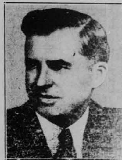
Henry A. Wallace