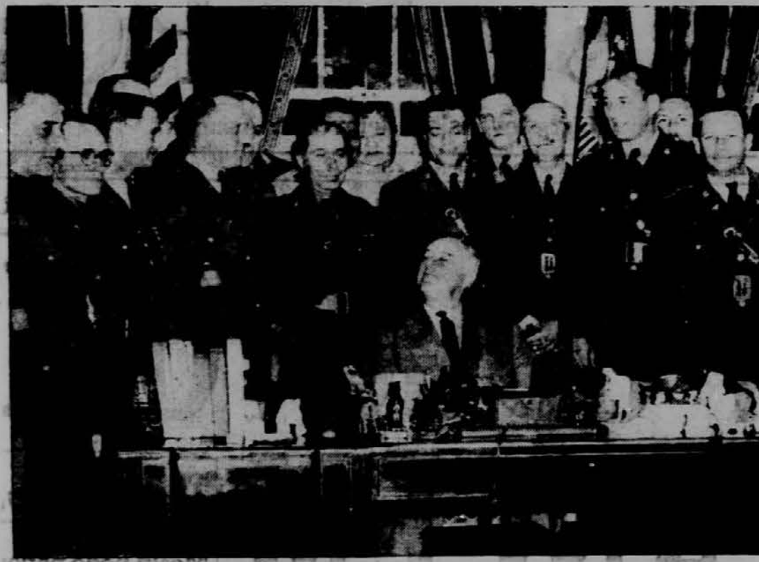
Prizor v Beli hiši, ko je predsednik Roosevelt sprejel in pozdravil vojaške zastopnike južno-ameriških držav, ki so bili povabljeni, da si ogledajo vojaške naprave.