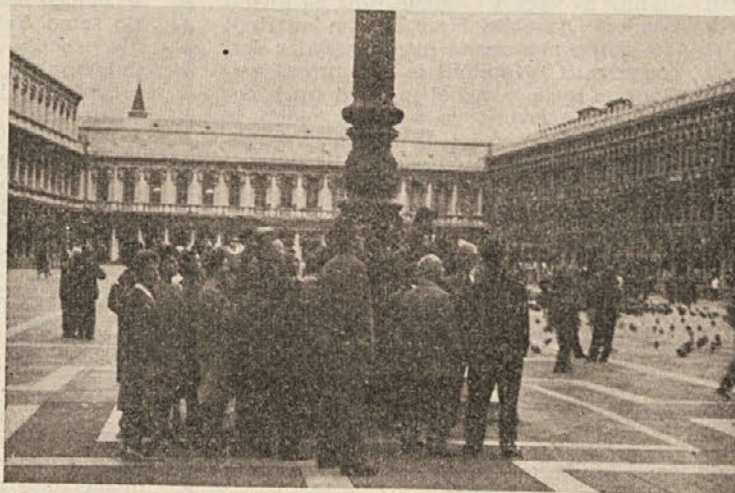
Benetke: Markov trg

lom. V njej je mnogo velikih slik iz zgodovine beneške republike. Med drugimi je tudi 75 slik beneških dožev. Za ogled Doževe palače in njenih umetnosti je treba vsaj 2-3 ure. Iz zadnjega trakta Doževe palače vodi na drugo stran kanala v kaznilnico »Most vzdihljajev«. Kogar je usoda zadel, da je šel kot kaznjenež iz Doževe palače po tem mostu preko kanala, se ni več vrnil. Markov trg obdajajo še znameniti urni stolp, na katerem dva bronasta kovača nabijata vsako uro po zvonu; stara in nova »Prokuracija«,