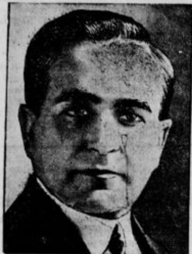
Getulio Vargas, predsednik brazilske države Rio Grande do Sul in vodja vstajev, bo imenovan za predsednika revolucionarnega gibanja. Pri zadnjih volitvah za predsednika Brazila je Vargas kandidiral, pa je podlegel svojemu nasprotniku dr. Prestesu.

Nekaj pa moramo ameriškim milijonarjem pustiti. Nimajo samo smisla za luksuzno življenje in uživanje, tudi kot mecenati znanosti se pogosto izkažejo. Marsikdo izmed njih je znanstvenik amater in s svojo jahto napravi tudi znanstveno potovanje. Drugi pa so zopet taki, ki na lastne stroške opremijo celo znanstveno ekspedicijo in dajo na razpolago svoje jahte, ki jih v ta namen opremijo z vsemi mogočimi tehničnimi napravami, kakršen je pač namen ekspedicije. N. pr. merjenje morske