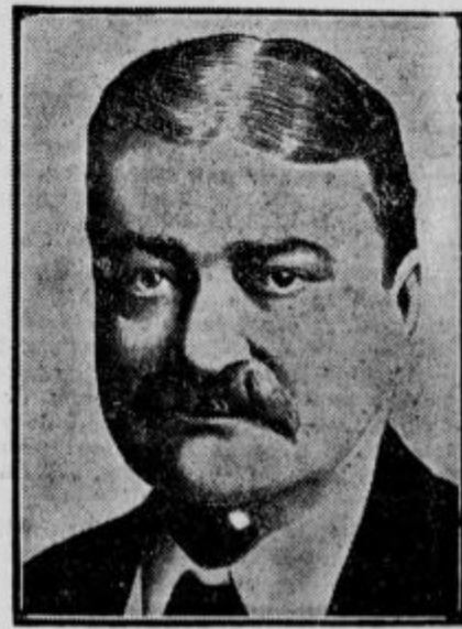
Allan Pinkerton, vodja največjega detektivskega zavoda na svetu, je v New Yorku umrl, star 54 let. Detektivski poklic je v družini Pinkertonov tradicionalen že skozi štiri generacije. — Stari oče Pinkerton je med drugim razkril atentat na predsednika Lincolnu.

Belgrad: 12.45 Koncert orkestra. 17.05 Recitacija. 17.30 Narodne igrice. 20.00 Prenos iz Prage: Simfonični koncert češke filharmonije. 22.15 Večerni koncert radio kvarteta. — Budapest: 17.40 Koncert ciganskega orkestra. 19.30 »Karnaval«, opera. Nato plesna glasba. — Dunaj: 19.35 Pevski večer komornega pevca F. Wolfa. 20.30 »Umetniška žilica«, opereta, E. Eyster. Nato plesna glasba na ploščah. — Milan: 19.30 Pestr koncert lahke glasbe. 20.40 (Prosto), nato koncert zabavne glasbe. — Praga: 18.20 Pianino koncert. 20.00 Koncert češke filharmonije. — Langenberg: 20.00 Koncert zabavne glasbe. Nato koncert lahke glasbe. — Rim: 12.45 Koncert radio kvinteta. 13.30 Koncert kvinteta. 17.00 Popoldanski koncert zabavne glasbe. 20.35 »Don Pasquale«, opera (Donizetti). — Berlin: 19.00 Koncert orkestra. 21.00 Koncert komornega kvarteta. — Katowice: 20.30 Večerni koncert narodne glasbe. 22.15 Pesmi. 23.00 Plesna glasba. — Toulouse: 18.55 Koncert radio orkestra. 19.30 Koncert zabavne glasbe. 20.30 Prenos iz opere. 24.00 Koncert lahke glasbe. — Mor. Ostrava: 18.00 Plošče. 18.35 Kabaret. 20.00 Koncert češke filharmonije. 22.20 Orgelski koncert.