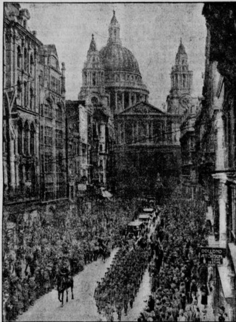
Pogreb žrtve katastrofe R 101 pred katedralo sv. Pavla v Londonu, v kateri se je vršila slovesna žalna služba božja v navzočnosti angleškega prestolonaslednika. Na čelu spreveda koraka oddelek letalcev.

globine, proučevanje favne in flore v posameznih globinah morja. Drugi zopet naloži na krov svoje jahte kakih 20 arheologov in gre z njimi na potovanje v kako neznano deželo. Ravno pred kratkim se je zgodil tak slučaj. Neki milijonar je na lastne stroške opremil ekspedicijo na neki še nepreiskani otok, kjer bodo preiskavali kamnite spomenike iz prejšnjih dob. Jahta ameriškega milijarderja Vanderbilta se je pravkar vrnila s svetovnega zoološkega potovanja.