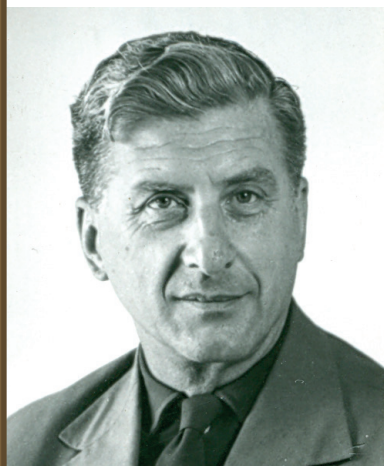
Arhitekt Edvard Ravnikar je pomembno zaznamoval arhitekturno dogajanje v drugi polovici 20. stoletja pri nas.

nološko arhitekturno retoriko usmeril na pot sodobnega časa. S svojim silovitim, izjemno izvirnim in eklektičnim izraznim arhitekturnim jezikom je v razburljivem povojnem svetu industrijske družbe v naš arhitekturni prostor vnesel duha sodobne tehnologije in množične produkcije.