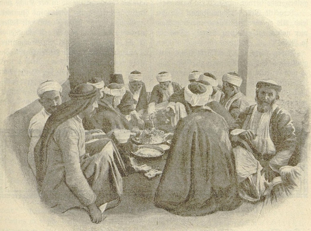
Die Druzen auf dem Berge Karmel nehmen ihre Mahlzeit ein.

Was er las, war die Geschichte vom armen Rinitshi in Nagasaki, der mit seinem alten heidnischen Vater an den Toren der Pagode bettelte, bis das beständige Rauern