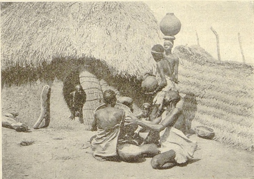
Schillukfrauen bei der Bierbereitung.

Heute gilt Bier und Biergenuss als typisch für den Deutschen und deutsche Sitte.