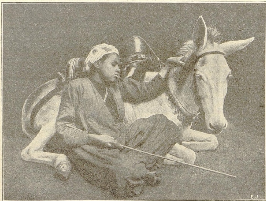
Raif in der Wüste.

Die fünf Läuferlinge waren aus der Sklaverei losgekaufte Negerknaben. Dr. Knob-