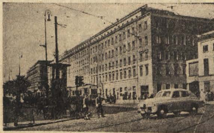
V novi Varšavi: Jerozochinska cesta

Popoldne so se nadaljevali razgovori med člani delegacije KPI in predstavniki ZKJ.