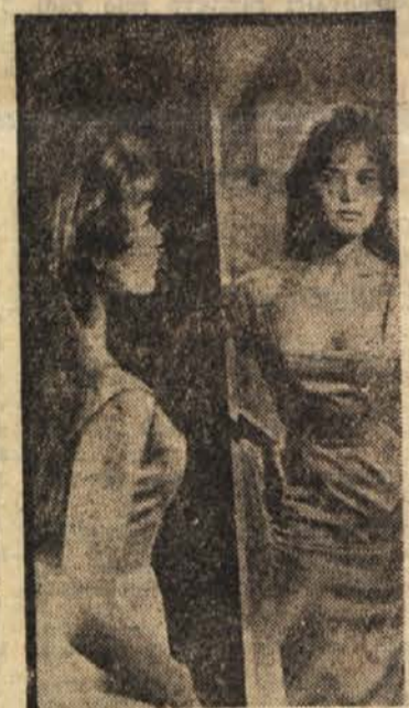
Alli je sploh treba spraševati: »Zrealce, zrealce povej?« Brigitte Bardot sodi nedvomno med najlepše Francozinje, v takšni podobi pa nastopa v najnovejšem filmu »Sla po ljubezni«

PRVA ATOMSKA TRGOVSKA LADJA Združene države so se odločile za gradnjo prve ladje na atomski pogon, ki bo namenjena samo potniškemu in trgovskemu prometu. Sovjetska zveza je pred kratkim že začela graditi prvi atomski ledolomilec na svetu. Stroški za ameriško ladjo bodo znašali 40 milijonov dolarjev, povprečna hitrost ladje bo 21 vozlov na uro, sprejela pa bo sto potnikov in 12.000 ton tovora.