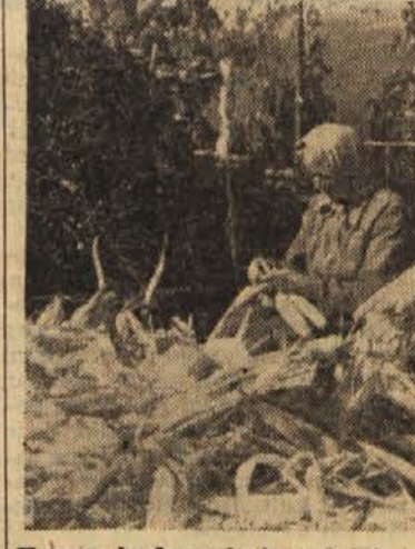
Koruzna je dozorela in sedaj jo povezujejo, da bi jo lahko obesili pod streho, kjer se bo sušila

Na področju mozirske občine bodo polletni občni zbori kmetijskih združenj kmalu zaključeni. Od 13. ZK so občini zbori že v 10 kmetijskih združenjih zaključeni. Iz razpravo na polletnih občnih zboreh je razvidno, da je bilo delo kmetijskih združenj v prvem polletju tega leta uspešno.