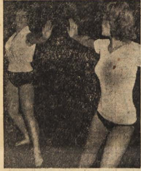
Pravilna telesna vzgoja pomeni zdravje, krepitve in razvedrilo