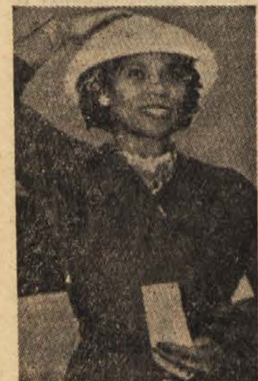
Slovita ameriška pevka Marian Anderson, ki je lani kot prva črnka nastopila v vlogi Carmen v newyorški operi Metropolitan, se je odpravila na trimesečno turnejo po evropskih deželah. Najprej bo nastopila v Stockholmu

Raziskave v zvezi z zemeljsko težnostjo, ki so jih opravili na britanski podmornici »Telemach« avstralski in ameriški učenjaki, naj bi natančno določile pravo obliko naše Zemlje. Velika Britanija je posodila to podmornico Avstraliji. Ladja je od 1. junija križarila po tako imenovanem podmorskem kanalu Tonga-Kermadek med Novo Zelandijo in otokom Tonga. Kanal je dolg okrog 220 km. V njem so največje globine sveta. Geologi in geofiziki se že od nekdaj zanimajo zanj, ker menijo, da pomeni začetno stopnjo v razvoju planinskega grebena. Ta »Telemachova« ekspedicija pomeni prvi skupni znanstveni pohod učenjakov Avstralije in Združenih držav.