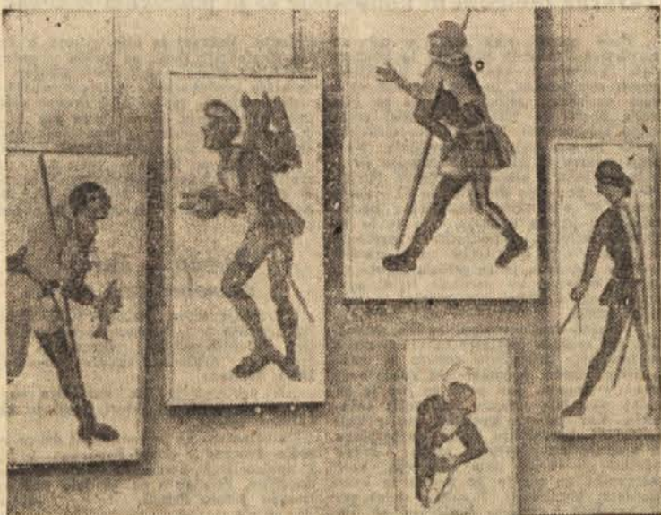
V okviru Mednarodnega tedna muzejev je bila včeraj dopoldne v ljubljanskem Mesnem muzeju otvoritev razstave renesančnih in baročnih noš. Na sliki: Detajli razstave, renesančne noše meščanov in platičev