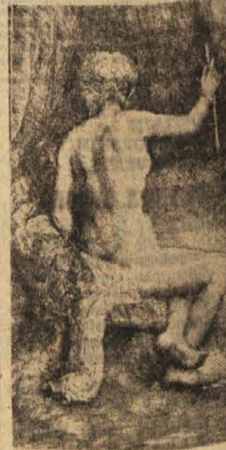
Rembrandt van Rijn: Žena s puščico (1661)