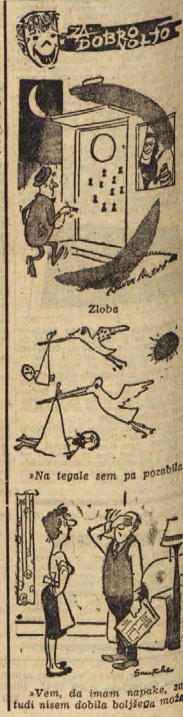
»Vem, da imam napake, zato tudi nisem dobila boljšega moža!«

126. Oba sta nepremično strmela tja. All je to mogoče? Iz temne notranjosti je šinila človeška roka in se krčevito oprljela kamnitega podboja. Kite na roki so se napenjale. Za njo je pogledala iz teme druga roka, ki je držala nož in iskala opore. Nekdo se je boril na življenje in smrt, da bi se izvlekel iz mračne odprtine. »Čudno,« je spet pomislil Danilo. »Moralo bi me biti groza!« Videl je, kako se je Maks pognal navzdol in mu brez misli sledil.