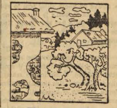
Kje se skriva ptica?

Morski valovi dosežejo tudi do 12 metrov višine, kar pa se zelo redko dogaja, medtem ko so valovi do 7 m višine precej pogosti. Največje valove so izmerili v južnem delu svetovnih morij. Posebno veliki pa so valovi, ki nastanejo na morjih ob priliki velikih potresov ali strabovitih vulkanskih izbruhov; ti dosežejo višino 15 ali še več metrov in uničujejo delujoče povsod tam, kjer naltajo na kašno oviro, bodisi otok ali pristaniške naprave, ter zahtevajo ogromno število smrtnih žrtve.