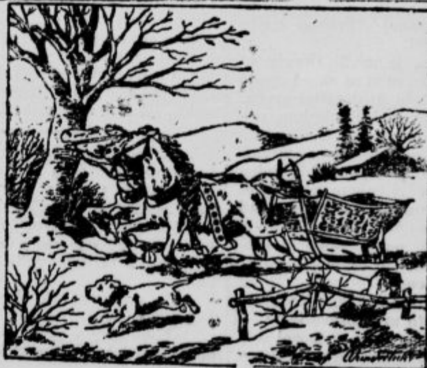
Kje je voznik?