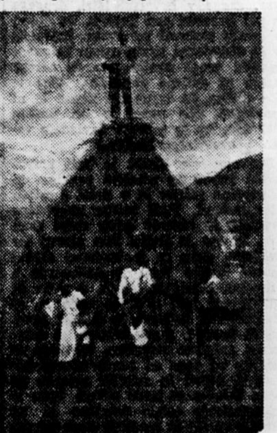
Kopa je gotova. Pozno v jeseni ali zgodaj spomladi jo bodo pridne roke spravile po primitivni žičnici v dolino.

Na Tolminkem letošnja sena ni došti vplivala na pridelek sena. Res je sicer nekoliko manjši od lanskega, vendar ni pod povprečjem, kajti lani je bil pridelek sena rekorden. Kmetje in vaški odbori Fronte se popolnoma zavedajo važnosti košnje, katere pridelek je susa marsikje hudo prizadelo. Zato bodo poskrbeli, da bo pokosen siehni košček travnikov, tako po senožitih kakor tudi v dolini, da bodo lahko s senom pomagali tam, kjer bo pač najbolj potrebno.