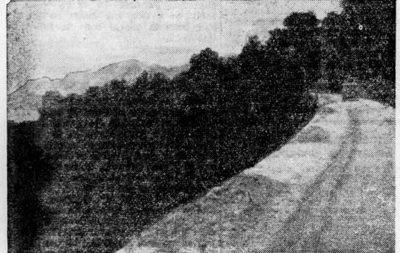
Borovi gozdovi med Omišem in Makarsko

Po osvoboditvi se je tudi gospodarski položaj na Krasu spremenil in vsak Kraševac, ki doma ne more živeti, lahko najde zaposlitev v industriji, kar mu prej ni bilo mogoče. Tudi vprašanje postopnega odpravljanja kozjerije ljudstvo zadovoljivo rešuje za Kras. Ostaja samo še v celoti vprašanje povečanja proizvodne sposobnosti kraških tal, tako kmetijskih kakor gozdnih, obenem pa izkoriščanje tistega aromatičnega in medicinskega rastlinstva, ki prekriva kraško kamnito puščavo, a katere prave vrednosti še danes malokdo prav ceni. Ko so padle stoletne pregrade, — a ostale padajo ena za drugo — ni več nikakega dvoma, da se bo podoba Krasa še v našem stoletju popolnoma spremenila in da bo vprašanje njegove pogozditve rešeno v najbližjih desetletjih. Inž. V. B.