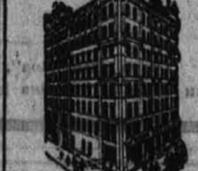
Podružnica v Pittsburgu 600 SMITHFIELD STREET, PITTSBURG, PA.