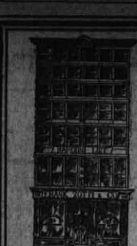
Glavni urad in centralni 108 GREENWICH STREET, NEW YORK.