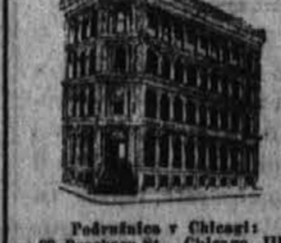
Podružnica v Chicagu 99 Dearborn St., Chicago, Ill.