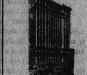
Podružnica 11 BROADWAY, NEW YORK, kotora se preloži s prodajanjem desanja vseh svetovnih držav.