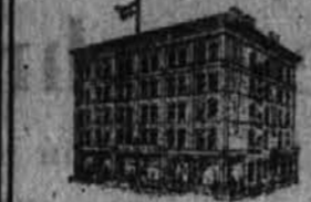
Podružnica 783 TENTH AVE., NEW YORK, za odobnost rojakov, v zvezi s poslovanjem dela mesta.