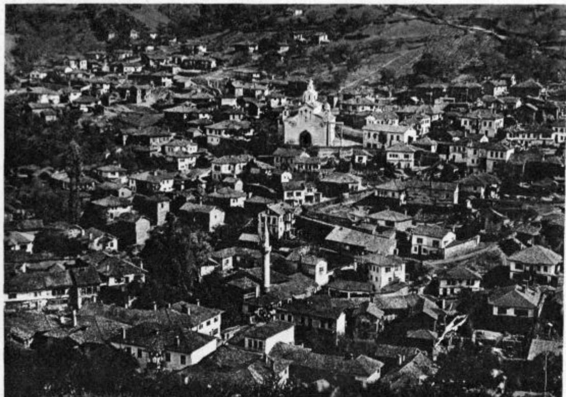
Janjevo na Kosovem polju.

Škofijsko vodstvo Apostolstva v Ljubljani.