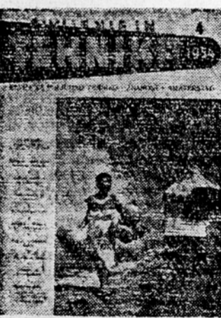
Dve nagradi prvomajeskega nagradnega natečaja sta tudi 2 celoletni naročniki na revijo »Življenje in tehnika«

Za svojimi stotim nastopom potrdil visoko umetniško raven. Temu uspehu je nedvomno pripomogel skrbno izbran program, ki je zlasti na koncu z Marcolivima skladbama »Moja ljubica« in »Nabavila najdalje Skerzjakovo pamjo »Moja ljubica mi