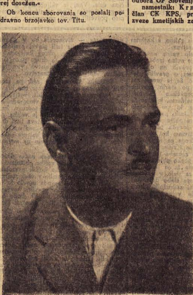
Boris Kidrič — kandidat I. volivnega okraja Ljubljane