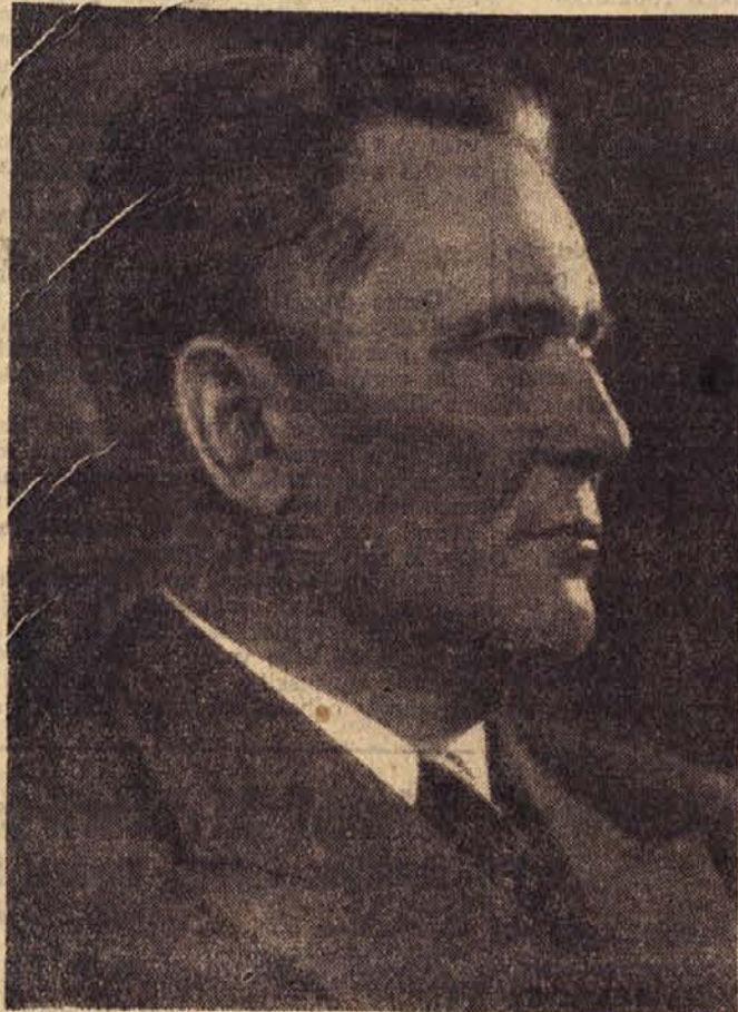
Maršal Jugoslavije Josip Broz-Tito — kandidat Bele Krajine