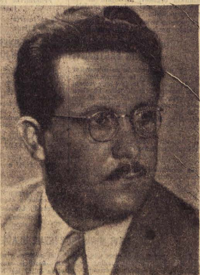
Edvard Kardelj — nosilec kandidatne liste OF Slovenije za Svet narodov