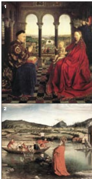
1.) Jan Van Eyck: Devica kanclerja Rolina. 1435. Olje na lesu. Louvre.

se je nanje tudi vzpenjal. Med njegovimi zapiski je opis vzpona na goro, ki jo imenuje Monbroso – večina raziskovalcev njegovega življenja meni, da je šlo za Monte Roso – in je bila tako visoka, da je Leonardo opazil, da je nebo videti bolj temno modro kot iz doline, oddaljene verige gora pa so bile kakor v modri meglici. Na podlagi teh opazovanj je napisal svojo znamenito teorijo o slikarski perspektivi pri slikanju pokrajine. Kodeks Leicester, zbirka njegovih rokopisov in skic, ki jo ima v lasti Bill Gates, pa tudi Kodeks Windsor, ki je v lasti britanske kraljeve družine, vsebujeta risbe gorskih vrhov, potokov, skalovlja, fosilov,