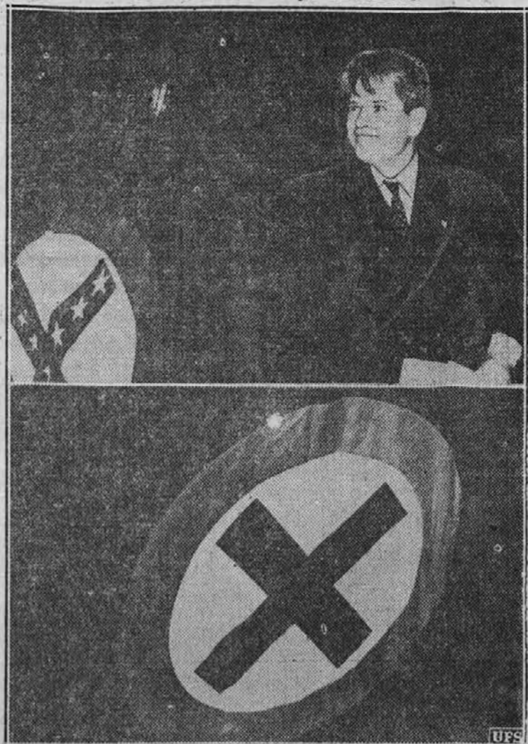
Governor države Wisconsin, Ph. La Follette, ki je nedavno objavil ustanovitev nove stranke narodnih progresivcev. Na sliki se vidi tudi znak nove stranke, namreč križ modre barve na belem polju v notranjosti rdečega kroga. Kakor pravi La Follette, pomeni križ glasovnico, torej ljudsko voljo, in krog znači zedinjeno ljudstvo.