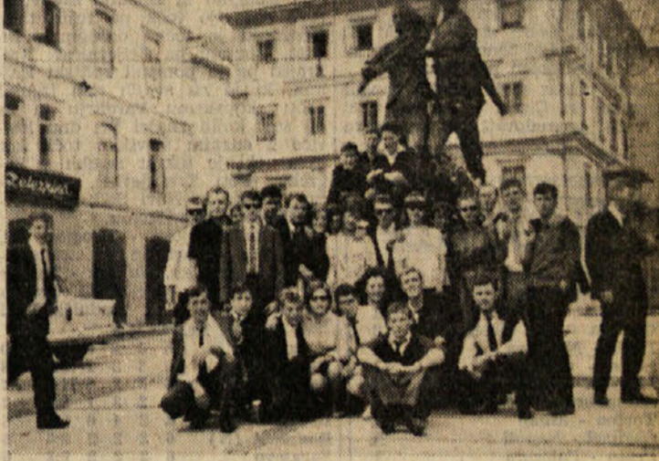
Skupina goriških mladine pred spomenikom v Idriji

Nogometna ekipa «Zvezda», s katero so se mladinci iz Goriške spopadli z ekipo idrijske mladine