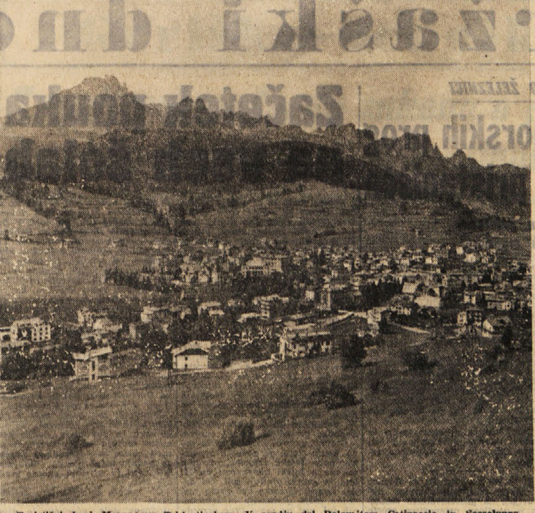
Turistični kraj Moena na Tridentinskem. V ozadju del Dolomitov: Catinaccio in Sasslungo

«Vidimo, da se pri nas ne bi občutili posledice nagle izgradnje težke industrije,» pravijo v Bukarešti. «Če bi ta izgradnja bila počasnejša, bi bili vsekakor za človeka mogli storiti tudi več. Vendar, ko smo morali izbrati, smo izbrali pač to pot. Po l. 1965 bo bolje, a po končani drugi šestletki — še bolje.» Zraven še pristavljajo: «Naši ljudje so disciplinirani. Zrtvujejo se, ker vedo za kaj.»