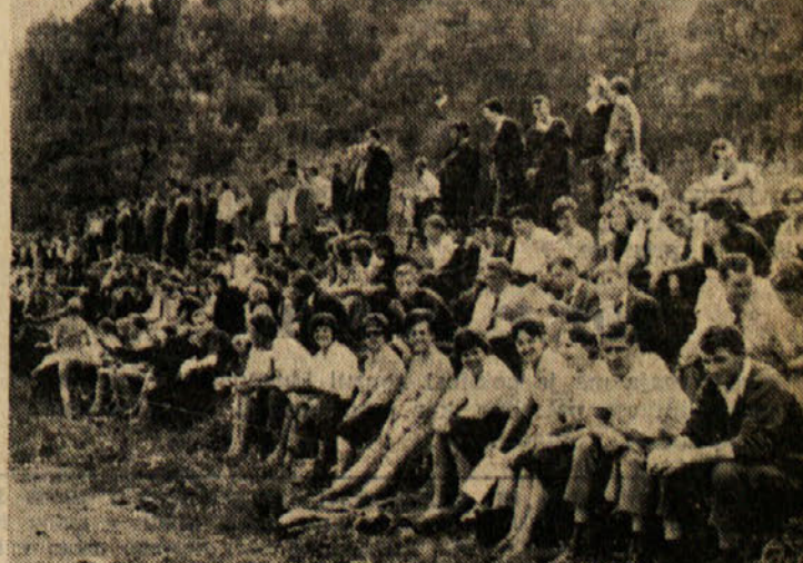
Mladina pozorno sledi tekmi