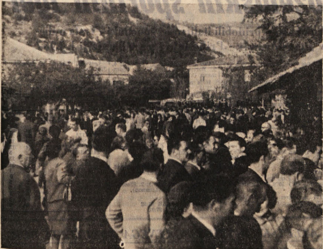
Pogled na živahno množico na boljunskem trgu