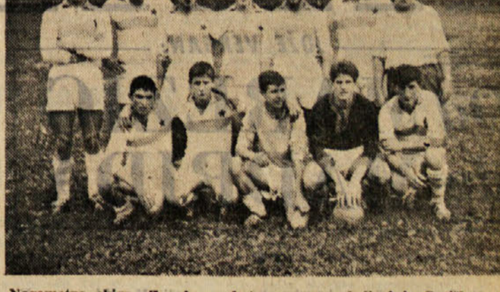
Nogometna ekipa «Zvezda», s katero so se mladinci iz Goriške spopadli z ekipo idrijske mladine