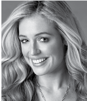
Cat Deeley, igralka, pevska, manekenka, TV voditeljica