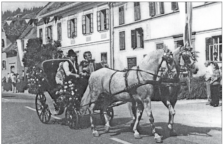
Krašena kočija v slavnostnem sprevedu ob otvoritvi Savinjskega gaja leta 1978.