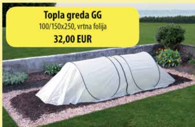
Topla greda GG 100/150x250, vrtna folija 32,00 EUR