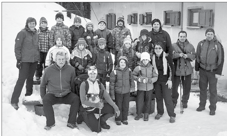
Na planinskem vikendu na Čreti se je letos zbralo 14 mladih planincev.