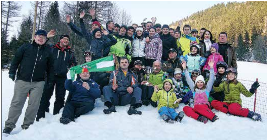
Skupno zmago so si zagotovili smučarji iz Krnice.