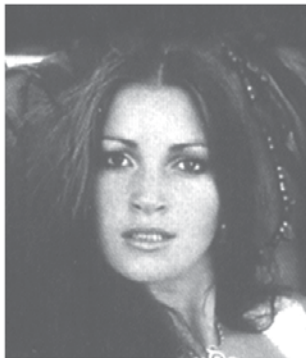
Jane Seymour, igralka (Dr. Quinn, Živi in pusti umreti)