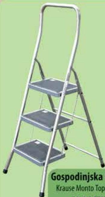
Gospodinska lestev Krause Monto Toppy XL3 42,00 EUR