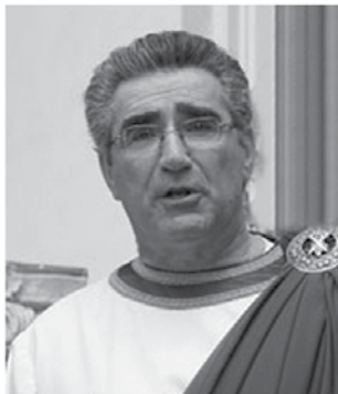
Eugene Levy, igralec (Ameriška pita)