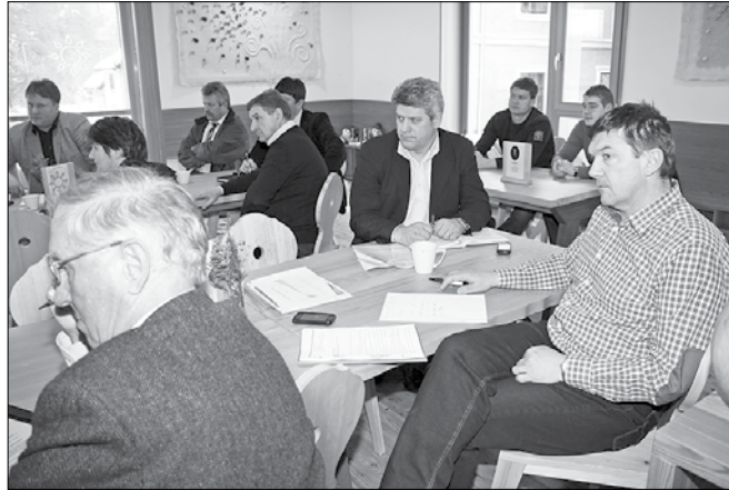
Udeleženci delovnega srečanja so prepričani, da ima Zgornja Savinjska dolina vse potenciale za oblikovanje lesarskega centra.

Lesarstvo je delovno intenzivna panoga in delo predstavlja visok odstotek v skupni masi stroškov, zato že dolgo apelirajo na državo, naj zniža dajatve na plače. »Cilj nam ne sme biti predelava lesa v bio-