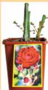
Sadika vrtnica več barv 5,50 EUR