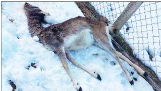
Vseh 16 živali, med katerimi so bile tudi breje košute, je raztrganih in poklanih ležalo v snegu.

Tako kot skoraj vsak dan preko zime je odšel na vikend, da bi nakrmil živali. Že v nedeljo jih koruza ni privabila, da bi pozdravile lastnika, in ko je v ponedeljek opazil, da je vsa hrana nedotaknjena, se je s slabim občutkom odpravil iskati damjake in v ograjenem prostoru naletel na grozljiv prizor. Vseh 16 živali, med katerimi so bi-