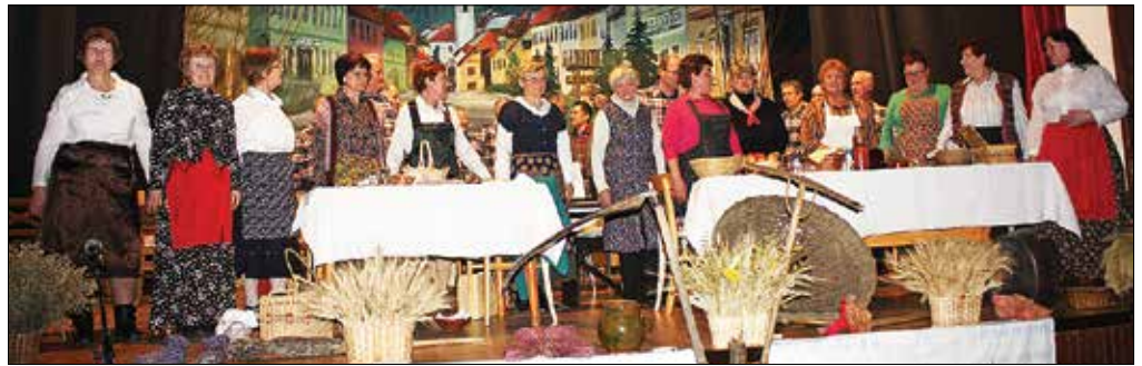
Pevci in pevke Kulturnega društva Mozirje so poslušalcem predstavili stare slovenske narodne pesmi.