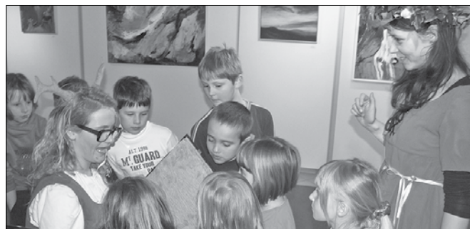
Otroci so se v družbi divje žene in lepe rusalke zabavali in v predstavi sodelovali s svojimi domisljicami.