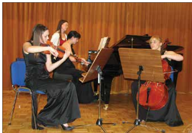
Klavirski trio Amarilis je skozi glasbene izvedbe predstavil večstranskost klasične oblike komorne skupine.

pravile malo manj klasičen program, katerega namen je predstaviti večstranskost te klasične oblike komorne skupine. V prvem delu koncerta so izvedle skladbo Trio za violino, violončelo in klavir enega najpomembnejših slovenskih skladateljev sodobne slovenske glasbe, Lucijana Marije Škerjanca, in klavirski trio v G duru francoskega skladatelja Clauda Debussyja. Iz pozne romantike in impresionizma v prvem delu koncerta so mlade nadarjene glasbenice