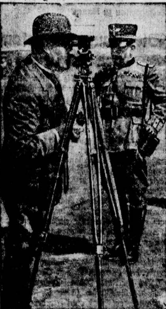
Mussolini am Scherenfernrohr.