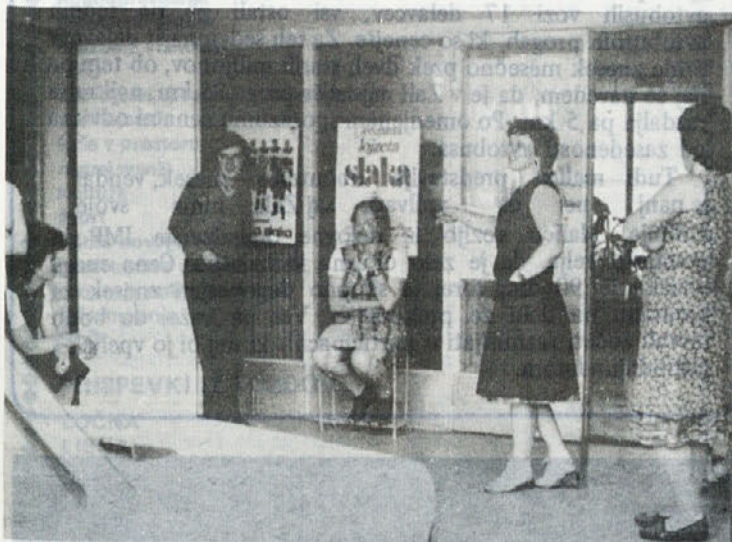
Med malico pred tozdom Temenica.

Torej treznega in odgovornega razmišljanja o možnostih še bolj doslednega stabilizacijskega obnašanja je precej, čeprav je bilo v vseh pogovorih poudarjeno, da je v proizvodnji težko kaj več iztržiti.