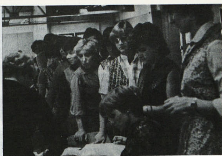
Ob delitvi osebnega dohodka v Delti.

Posnetek kaže del poslopja idrijske Zale ter del dvorišča sosednje delovne organizacije. Sosedje, gradbinci, že več let mirno uporabljajo tri in pol metra Zalinega prostora ob zgradbi. Tako Zala nima prostora za obhod okoli zgradbe. Poleg tega pa železno načtenja fasado, ob odlaganju materiala se često poškodujejo Zaline šipe, dvigalo pa kroži tik nad streho. Nešteti dopisi doslej niso še nič pomagali . . .