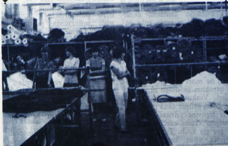
Člani uredniškega odbora našega glasila smo si pred sejo ogledali tudi proizvodnjo v Tip-topu.