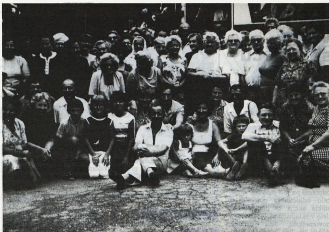
Z izleta odnašajo upokojnici Delte najlepše vtise. Posnetek je bil narejen tik pred odhodom domov.

Če ne bo mož (zdravljeni alkoholik) znal potrpeti in se z normalnim vedenjem in prizadevnim delom (z vidnimi rezultati) skušal „odkupiti“ za nekdanje zdrahe in si tako počasi pridobiti zaupanje družine, bo seveda nekaj časa trezen vegetiral. Sledi recidiva alkoholizma z neizbežnim propadom.