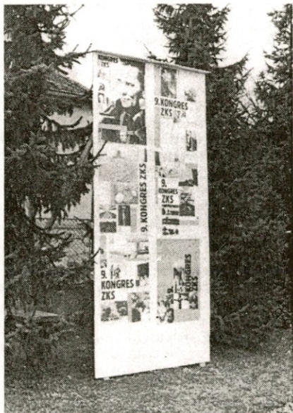
Pano s plakati za 9. kongres ZKS