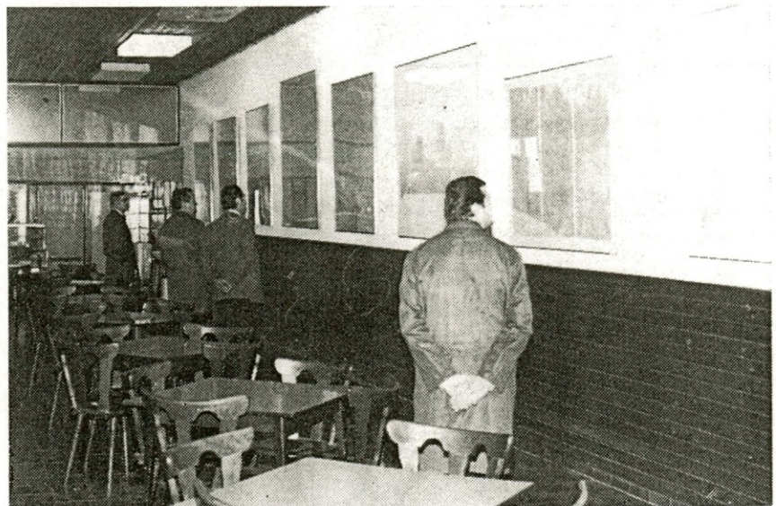
Razstava slik v naši jedilnici v Jaršah

Po statistiki nam je poznano, da je med našimi sodelavci veliko takšnih, ki so si uspeli s pridnostjo in varčevanjem zgraditi svoj dom. Samo predlog je to: okrasite notranjost vaše najlepše sobe s kakšno umetniško sliko. Morda jo boste lahko kupili za soliden znesek in morda bo prav ta slika kdaj pozneje vredna celo bogastvo. Morda!