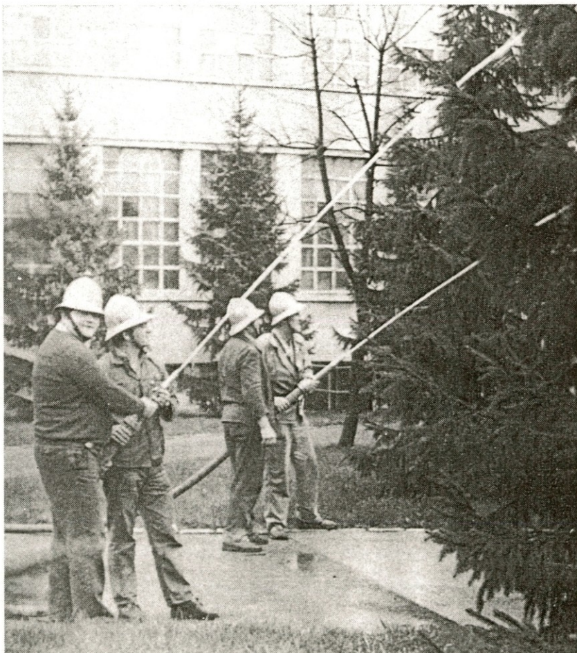
Namišljen požar — seveda, bila je le vaja