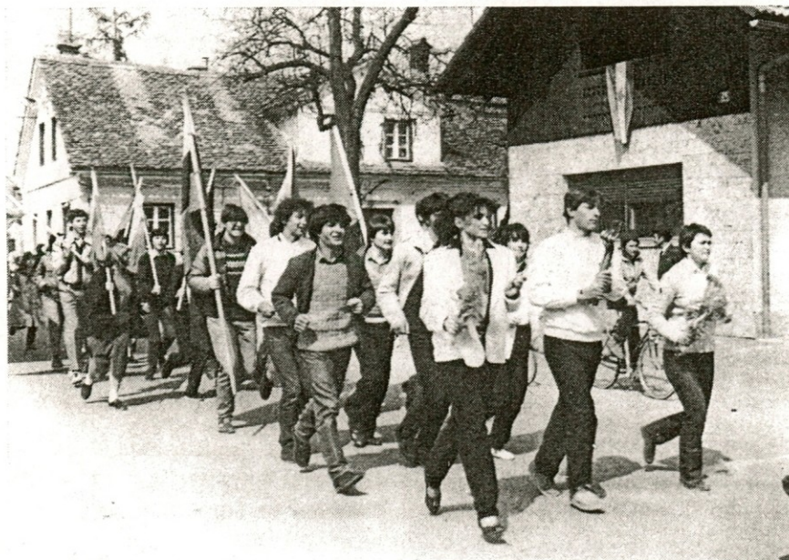
Naši mladinci s štafeto mladosti