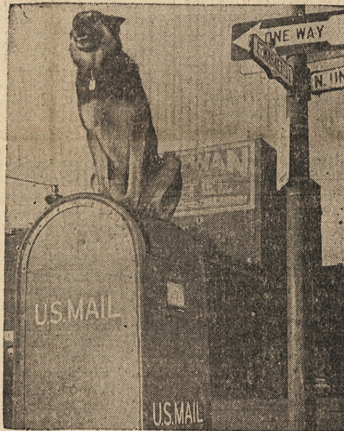
POSTNI ČUVAR? — Pes Scamp v Limi v državi Ohio se rad spravi na poštni nabiralnik. Tam čepi mirno in ogleduje svojo okolico, ne da bi kaj motil one, ki mečejo pošto v nabiralnik, pa tudi ne poštarje, ki pošto pobirajo.