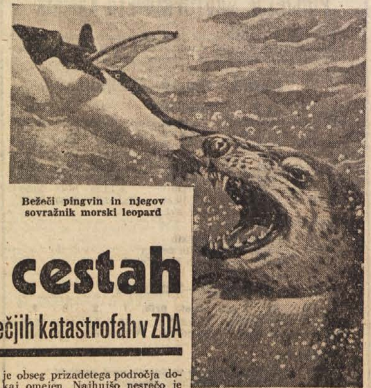
Bežeči pingvin in njegov sovražnik morski leopard

Z letalom bodo prepeljali jato pingvinov nad 8000 km daleč. Vse doslej so bili brezuspešni vsi poskusi preselitve teh živih ostan- kov zemeljske ledene dobe. Kra-