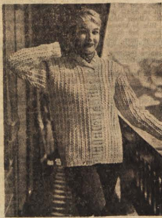
Čedna sportna topica

nekateri cvetni listi. To pa zadostuje, da postane veliki cvetj malo vredno. Vse, ki se do 1. novembra ne bodo razcvetele, poržite in dajte v mrazilo vodo, ki ste ji primešali nekaj kuhinjske soli. Se boljše storite, če postavite posode s krizantemami v zmereno toplem prostor, kjer se hitro razcveto. Miha Ogorevc