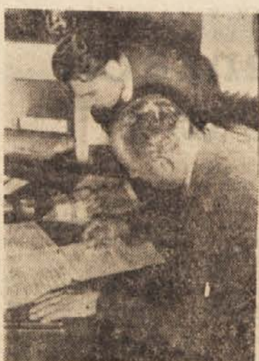
Kdo bi utegnil misliti sedaj še na kaj drugega? Čas beži. Volilna komisija je pravkar prevzela volilno gradivo.