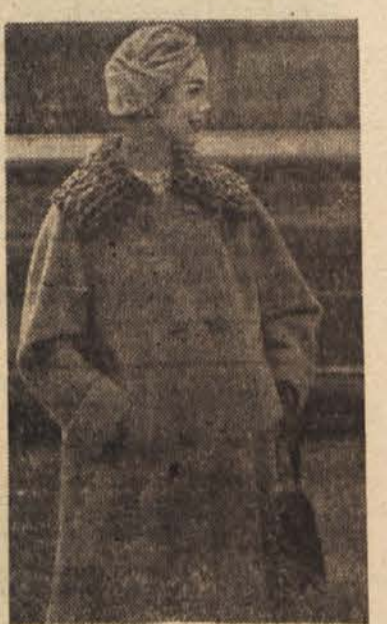
Plašč iz mehkega volnenga blaga, širok in ima dve vrsti gumbov, ovrtnik je krznen