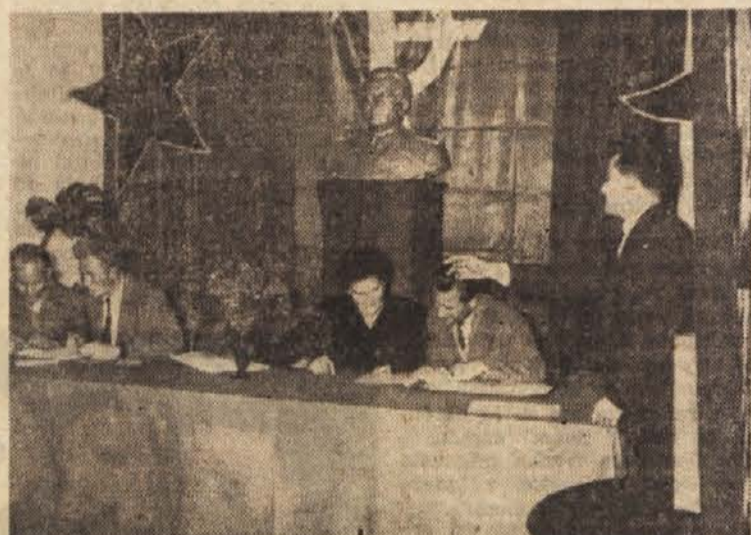
Volilne komisije so imele včeraj polne roke dela. Ko je bilo v Domu sindikatov vse pripravljeno, so še enkrat pregledali volilne spiske.

Ljubljana, 19. oktobra. — Danes popoldne smo obiskali nekatera ljubljanska volišča. Tako smo se najprej ustavili v Smoletovi ulici 16. Dvoje volišč je v tej leseni zgradbi; v pritličju in v prvem nadstropju. Medtem ko so v pritličju še likali zastave, jih primerjali na zidu in jih pritrjevali z risalnimi žeblički, so v prvem nadstropju že skoraj vse pripravili. Člani volilne komisije so sedeli za mizo in pregledovali