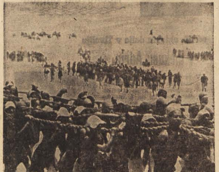
Brez tednika. Predstave ob 15, 17, 19 in 21. Ob 10 je matineja istega filma. V glavni vlogi: Jack Hawkins

KINO »VIČ« AMER. BARVNI CINEMASCOPE FILM v stereofonskem zvoku (magnetni sistem) »Dežela faraonov«