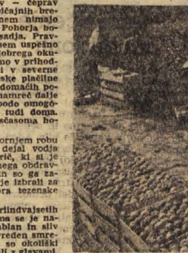
Pohorske breskve so letos mnogo-laje uspešno konkurirale

na njihova posestva. Spričo takšne kooperacije smo v lastni režiji skorajda neverjetno poceni uredili pretež gaj, ki je že pričel počeno mečbiti celo nejevolnost starih pohorskih občancev. Tako: