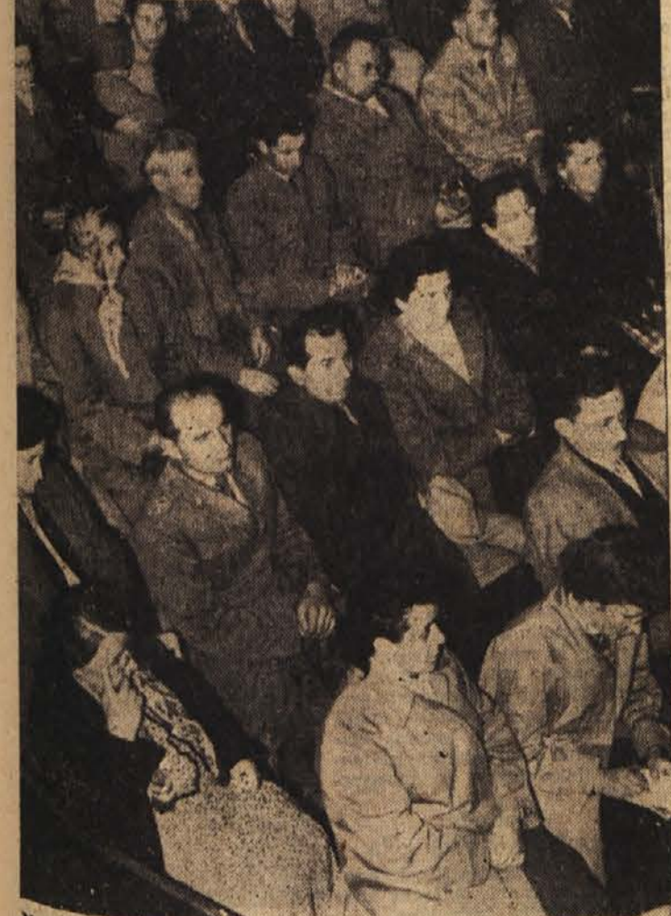
Nad sto tisoč ljudi je sodelovalo na predvolilnih sestankih in zborovanjih, danes pa bo več milijonov volivcev v Sloveniji, na Hrvaškem in Makedoniji izvolilo odbornike za občinske zore

Izredno pozitivno je glede teh volitev tudi, da celotna vo- lilna akcija ni samo ob podprta- vanju splošnih socialističnih značilnosti, ampak da je bila zelo konkretna. Te volitve zato v političnem pogledu obračuna- vajo še s poslednjimi ostanki birokratskega gazdovanja v ob- činah, obračunavajo s pojavi primitivizma, lokalne odboje- nosti in nesposobnosti. V neka- terih občinah so še primeri, kjer občanom ne pojasnjujejo dovolj delo občinskega ljudskega od- bora. Preveč se še sklepa za za- prtimi vrati in še se dogajajo stvari, s katerimi se volivci ne strinjajo. Sedanja volilna raz- gibanost bo tudi tem preživelim metodam in navadam zadala krepak udarec. Socialistična za- vest državljanov je dosegla že tako stopnjo, da si je nemogoče zamisliti dobro delo recimo ob- činskega ljudskega odbora, če le-ta, razen tega, da sprejema dobre sklepe in vodi pametno politiko, ne poskrbi tudi za to, da bo nenehno poujšnjeval svojim občanom svoje delo, sklepe in načrte ter poslušal tudi mnenje volivcev. Predosem aktivisti So- cialistične zveze bi morali biti nosilci takega sistema dela v ob- činskih ljudskih odboraх.