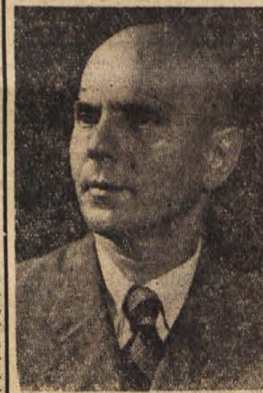
goriča ob njegovem 65. rojstnem dnevu in 40-letnici revolucionar- nega dela za izredne zasluge, ki si jih je pridobil v socialistični izgradnji FLRJ.