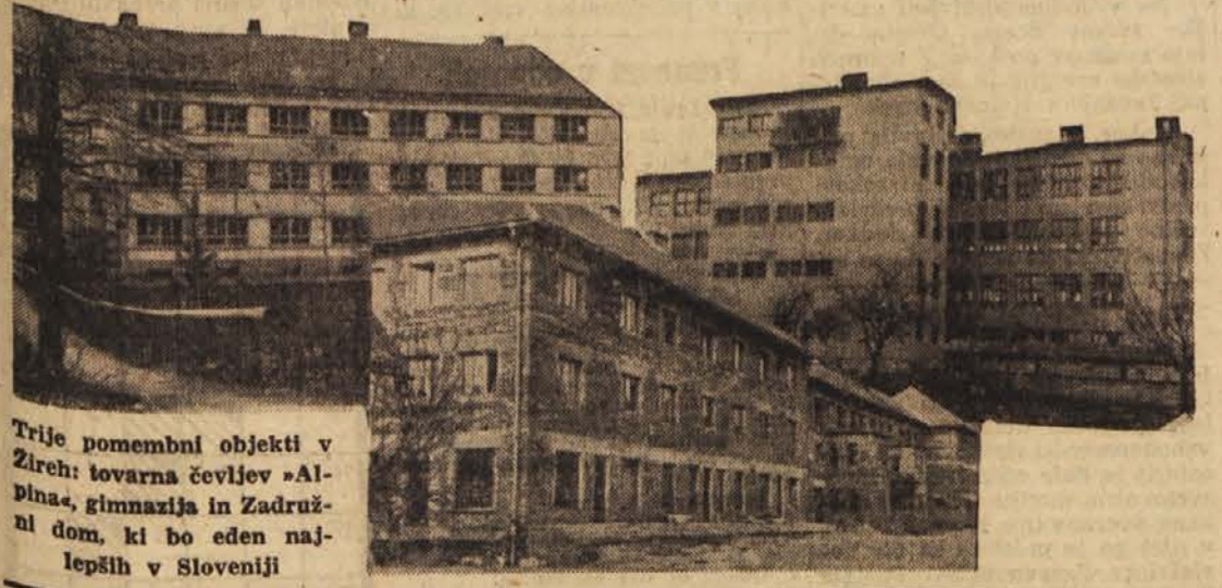
Trije pomembni objekti v Žireh: tovarna čevljev »Alpina«, gimnazija in Zadržni dom, ki bo eden najlepših v Sloveniji