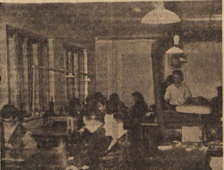
Delavnica obrtne zadruge »Kroje«

razvidno, kako se da tudi na slabšem zemljišču z agrotehničnimi ukrepi znižati produkcijske stroške na račun povečanja hektarskih donosov. Če pogledamo razvoj gospodarstva v industriji in obrti,