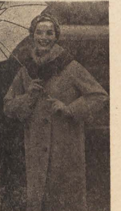
Zimski plašč iz kamelje dlakovi-ne, ovrtnik je okrašen z nizkim krznom

Desni sprednji del: nasnujemo 46 pentelj in pletemo 2 cm visok rob v vzorcu št. 1. Delo nato nadaljujemo v vzorcu št. 2 kot hrbet in v 1. vrsti dodamo še 4 pentlje, na eni strani, to je ob stranskem sivu, dodajamo prav tako, kot smo dodajali pri zadnjem delu, tako da imamo takrat ko začnemo snemati za rokavni izrez na pletilki 85 pentelj. Za rokavni izrez snemamo trinajstkrat po eno pentljo v začetku vsake vrste. Nadalje pa dodajamo petkrat po 1 pentljo pri rokavnem izrezu na 2,5 cm razdalje. Pri