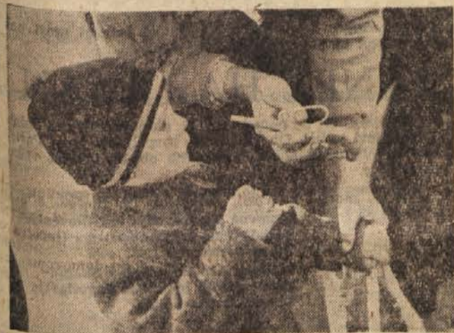
Včasih mu le napravimo veselje

Minkin obraz je blede, njena umska zmogljivost v šoli se manjša. Njena pot v bodočnost — v vse lepo — je zagrenjena. Dekle postaja boječje, plašno, njen značaj se šibi pod težo očetovega nasilstva. Namesto krepkega in zdravega člana naših družbe bo zrasel notranje razdvojen človek. Šibak