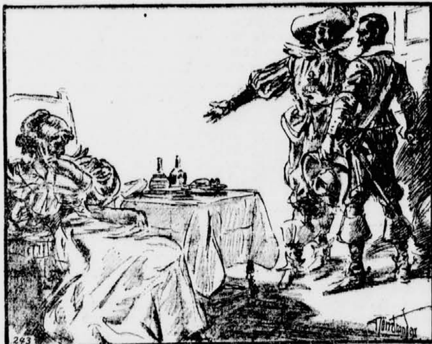
Der erste Akt

Felton wandte sich um. »Nun, ist es Ihnen besser geworden, gnädige Frau.« sagte er, »ich habe also nichts mehr hier zu schaffen.« »Ach Gott! Wie habe ich doch gelitten.« sagte Mylady halblaut und legte einen Klang in ihre Stimme, der alle bezauberte, die sie zu verführen beabsichtigte. Und indem sie sich etwas aufrichtete nahm sie eine Stellung ein, die wenn möglich noch mehr herausfordernd war.