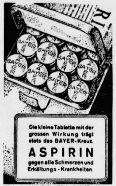
Die kleine Tablette mit der grossen Wirkung trägt stets das BAYER-Kreuz. ASPIRIN gegen alle Schmerzen und Erkältungs-Krankheiten. Annonce reg. S. Nr. 23762 od 19. XI. 1934.

m. Feier in den Saantaler Alpen. Sonntag, den 30. August, wird auf dem Kamniko jeblo in den Saantaler Alpen das dreißigjährige Bestehen der dortigen Schutzhütte feierlich begangen. Die Hütte auf dem Kamniko jeblo, die im August 1906 eröffnet wurde, ist die erste Alpenhütte des Slowenischen Alpenvereines in den Saantaler Alpen. Bei der Eröffnungsfeier waren über 260 Touristen anwesend. Bei der Feier am