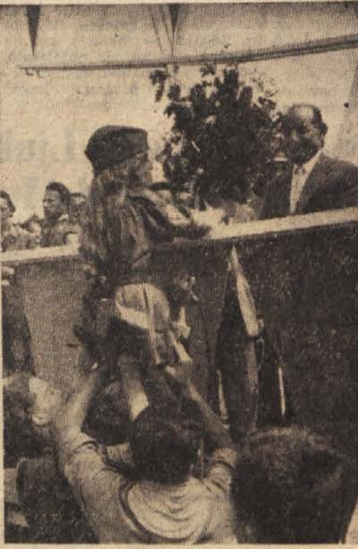
Drugi pregled Zvezizvidnikov Jugoslavije na Palah pri Sarajevu je otvoril predsednik Ljudske skupščine Bosne in Hercegovine Djuro Pucar. Na sliki: Pionirka izročila tovarišu Pucarju šopek cvetja. (Glej poročilo na 2. strani.)