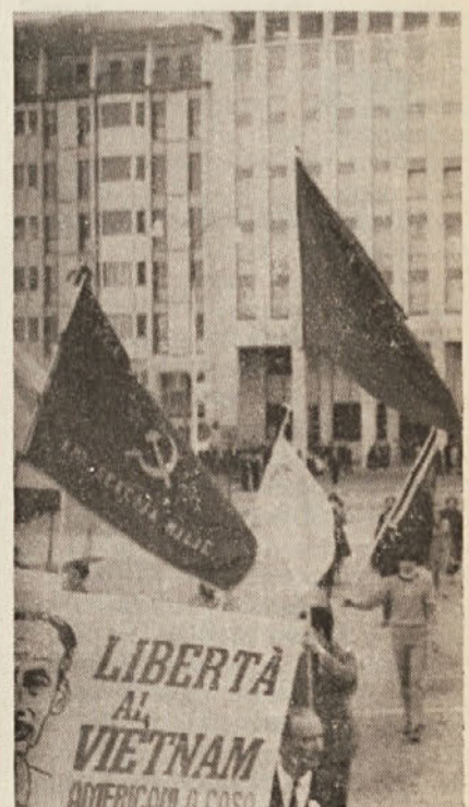
Pred kratkim je bila v Pordenonu vsedežna manifestacija za mir v svetu in proti vojaškim služnostim. (Na sliki delegacija iz Milj)

Vlada Demokratične republike Vietnam iskreno poziva vlade in narode socialističnih držav, držav, ki želijo mir v svetu in ameriško napredno prebivalstvo, naj v še večji meri podpro pravizem boj vietnamskega ljudstva in vlade Demokratične republike Vietnam.