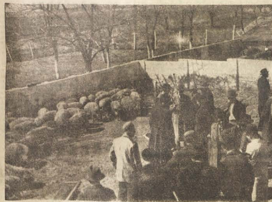
Pri ogledu svinjakov na državnem posestvu v Belju

Vaščani iz Srednje Konoplje, Vojkega, Zadolga so sprejeli zadružnike, ki so bili v Vojvodini, z besedami: »Govorite,