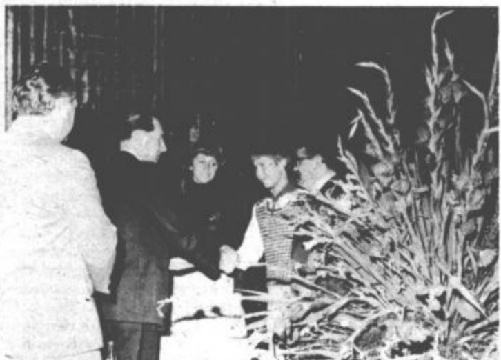
... in osnovno šolo Karel Destovnik Kajuh Soštanj