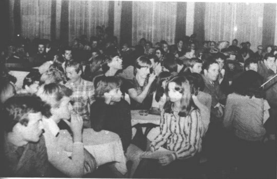
Mladi in starejši brigadirji so izmenjali izkušnje