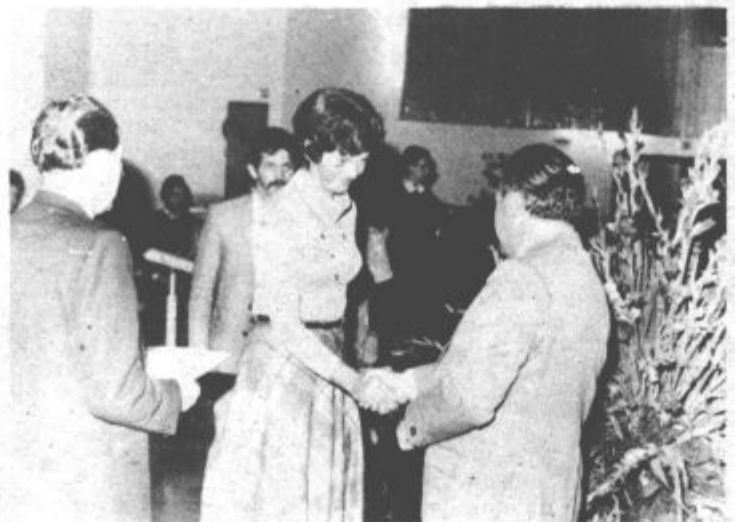
Kajuhova nagrada za Kulturno društvo Šmartno ob Paki ...