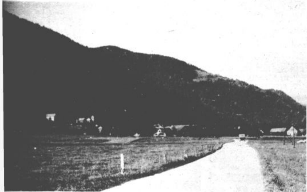
Prijeten kraj je Bočna ob vznožju prostrane Menine