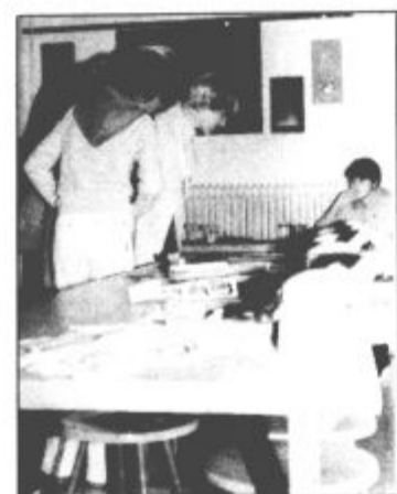
Na osnovni šoli Štirinajste divizije so pripravili razstavo ročnih del