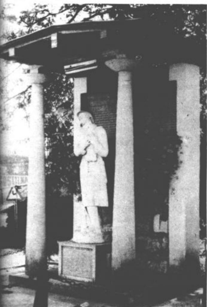
...je tudi spomenik, posvečen žrtvam prve in druge svetovne vojne

Krajevna skupnost Bočna se je oblikovala šele pred štirimi leti - Velike naloge so že opravili in obilne načrte še imajo - Usmeritev v kmetijstvo - Vse manj znanega bočkega krompirja