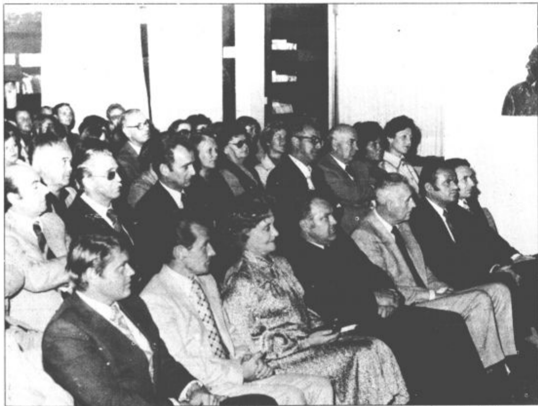
Otvoritev razstave Meštrovičevih del je vzbudila izredno veliko zanimanje. Poleg domačih obiskovalcev so si jo ogledali tudi mnogi obiskovalci od drugod. Med gledalci pa so bili tudi predstavniki iz pobratenih mest