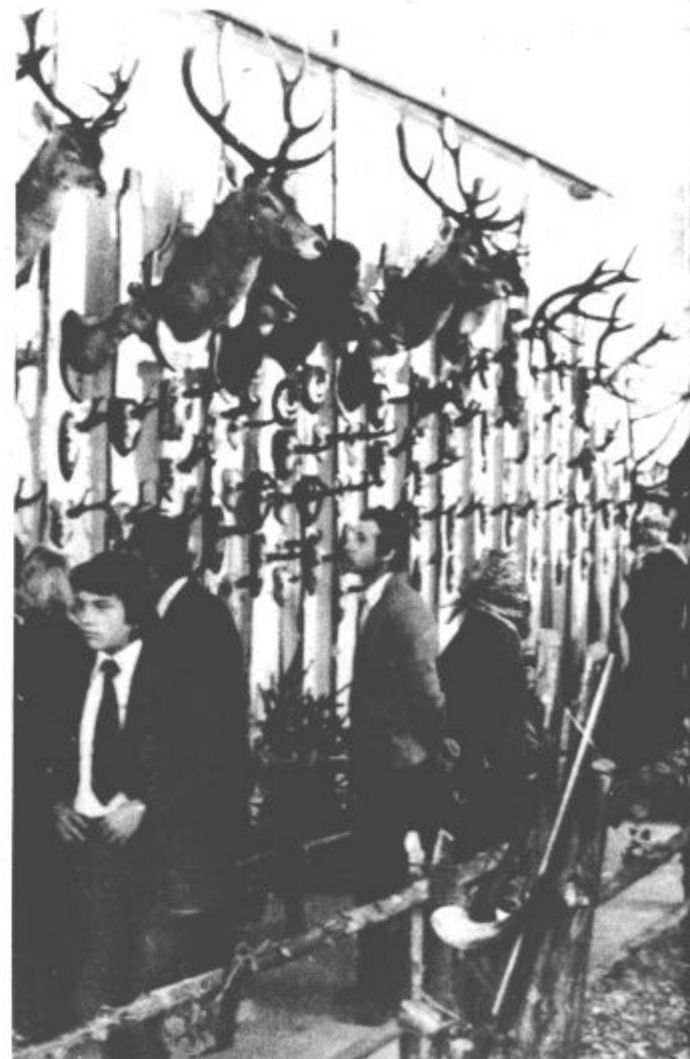
V sindikalnem domu je bila zanimiva lovsko in ribiška razstava

S to otvoritvijo so bile končane prireditve ob krajevnem in občinskem prazniku v krajevni skupnosti Šoštanj B. Z.