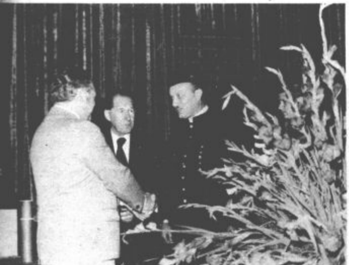
Srebrni grb za člane jamske reševalne čete RLV

agresiji ZK so potrdili pravilnost dosejanega uresničevanja vseh in zakona o združenem delu in še bolj poudarili odločilno vlogo delovnih ljudi pri uveljavljanju z vsemi družbenimi dobrinami. Odločitve konference zveze komunistov, ki so bile plebiscitarno podporo naših delovnih ljudi in občanov, nas obvezujejo, da zgradimo takšne politične in družbenoekonomske odnose, v katerih bo moč uveljaviti neposredno odločanje. Uspešno izvedene volitve v delegatske skupščine krajevnih skupnosti in krajevnih konferenc socialistične zveze delovnih ljudi, in drugih oblik političnega in samoupravnega povezovanja občanov, moramo v naš sistem neposrednega družbenega samoupravljanja pritegniti slehernega občana, kajti le na ta način bomo lahko zagotovili najbolj demokratično usklajevanje vseh