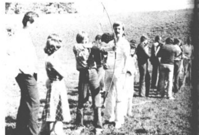
Takšen lokostrelski živ-zav je bil 8. oktobra pod velenjskim gradom