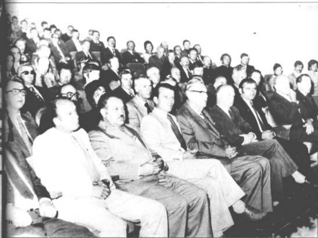
Udeleženci svečane seje