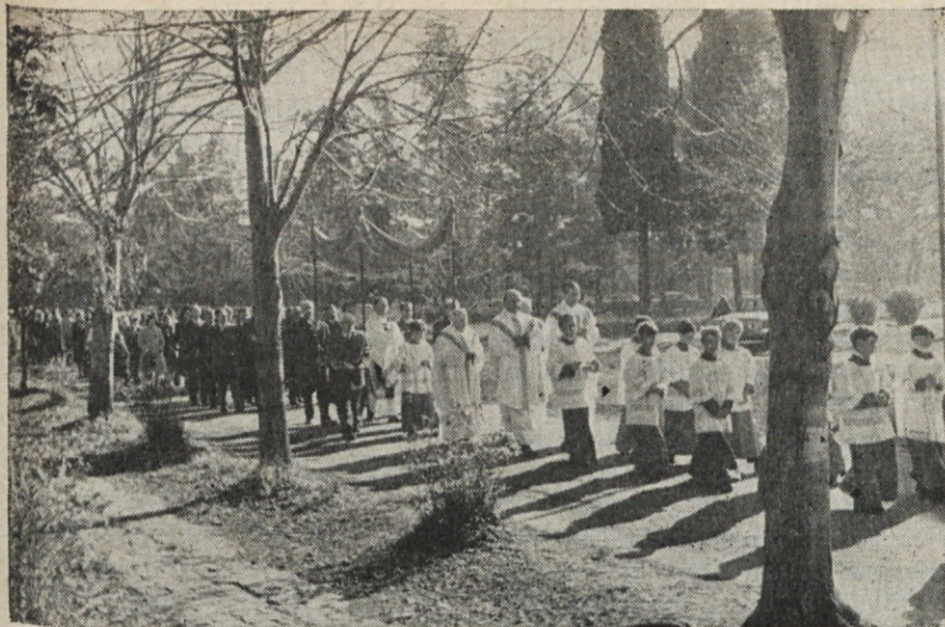
Procesija sv. Rešnjega telesa bo letos v nedeljo 8. junija.

razodetje božje ljubezni do človeštva, do vsakega človeka, razodetje ljubezni Očeta in Sina in Svetega Duha.