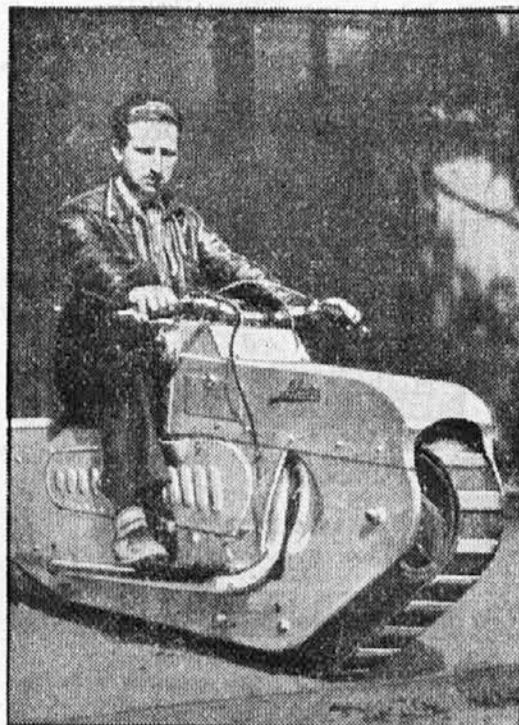
Slepec je izumil posebno motorno kolo, ki je podobno tanku. Pri tekmovanju izumiteljev v Parizu je prejel prvo nagrado

Zgodovina loterije je vezana z mnogimi prigodbami. Tako se je zgodilo pred kratkim v Italiji, da je prišel v Firenzi k brivcu nek gospod, ki je dal brivcu za enkratno britje srečko velike loterije v Tripolisu, čes da ima samo debel denar in ne bi rad menjal. Brivec je vzela srečko. Srečka je zadel a brivec je dobil za enkratno britje 20.000 dinarjev. Nič manj ni zanimiv slučaj, ki se je zgodil v Švici. Nepoznani dobitnik velike loterije je dobil 100.000 frankov. Ta pa ni sprejel vsega denarja, čes da ni igral zato, da bi dobil, pač pa, da podpre uslanovo — igrali so namreč za brezposelne in se zadovoljil samo z 2000 franki.