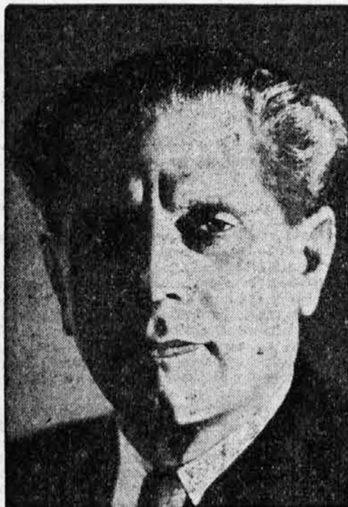
Max Reinhardt, veliki gledališki in filmski režiser, dela zdaj film po romanu Dostojevskega »Igralec«

Ko se začne sezona v gledališču in filmu, zama obiskovalce kina in ljubitelje filma, kakšen program jih čaka. Priobčili bomo izvečke iz letošnjih programov filmskih družb in opozorili občinstvo na dela, ki se jih bo splašalo videti. Poglejmo najprej, kaj pripravlja Warner Bros-ova družba, ki se je v zadnjih dveh sezonah uveljavila po mojstrskih filmih, katerim so za podlago služila velika dela iz svetovne književnosti.