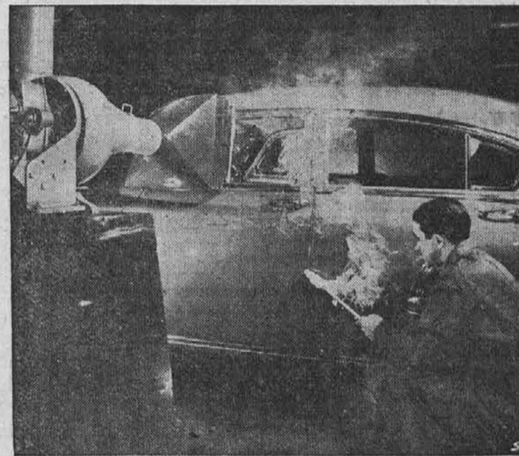
The man above isn't a firebug trying to burn a car. He's an engineer applying a smoke test to a new 1949 model automobile in the Fisher Body laboratories in Detroit. The machine at the upper left creates a vacuum inside the car and the engineer, by passing the smoke torch around door and window openings can quickly determine if there is an air leak. Details of this and numerous similar ingenious automotive experiments are featured at the General Motors "Transportation Unlimited" show in New York this month.