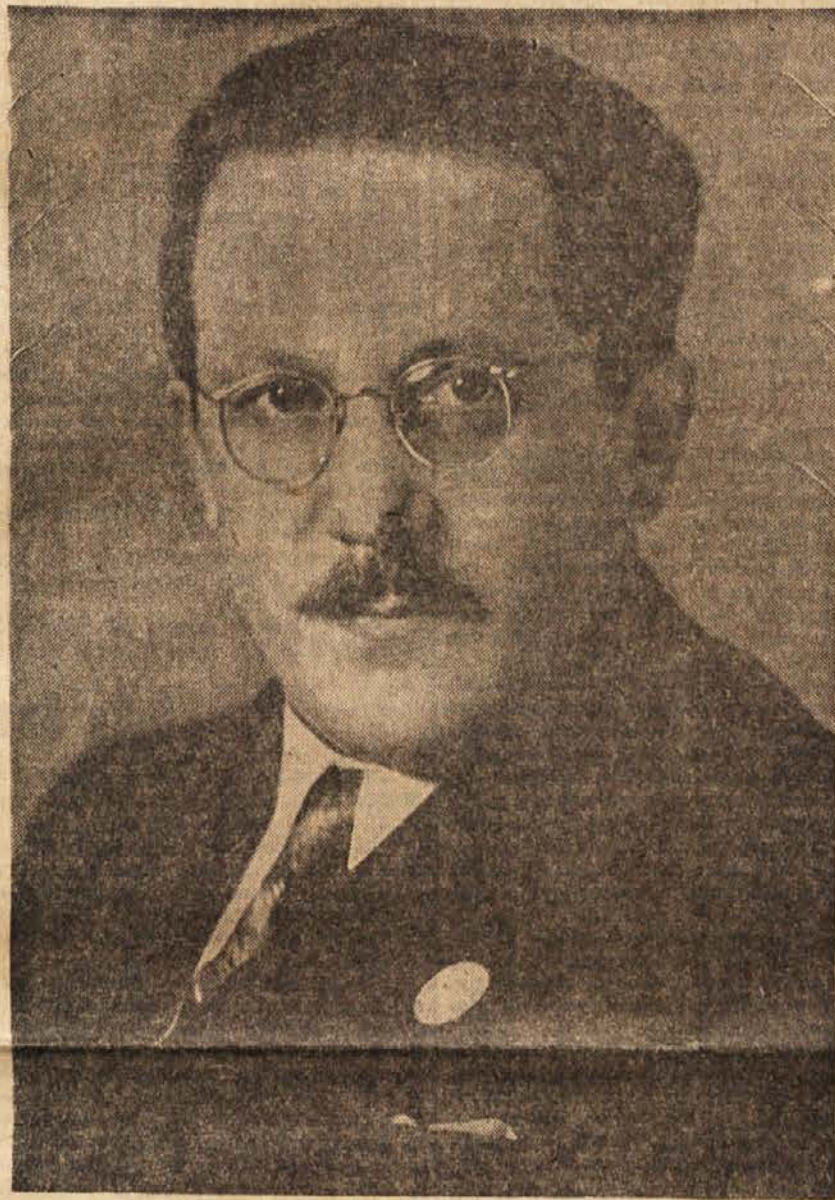
Podpredsednik zvezne vlade in minister za zunanje zadeve FLRJ Edvard Kardelj

Kakšno bi bilo delo OZN, če bi se ta organizacija odrekla prav tistemu