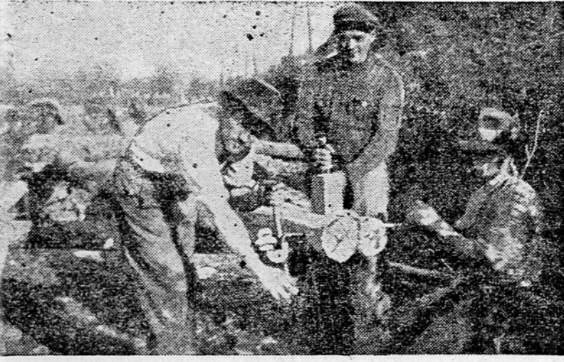
Slika št. 2

Tako je bilo v stari Jugoslaviji. Prav zaradi tega ljudski talenti niso imeli nobene možnosti, da bi uspeli in se razvili. Danes je drugače. Danes se nudi vsakemu možnost, da razvije vse svoje sposobnosti v svoj prid in v korist celokupnosti. V tem pa je največje jamstvo, da bo naša domovina kmalu zaživela lepše življenje.