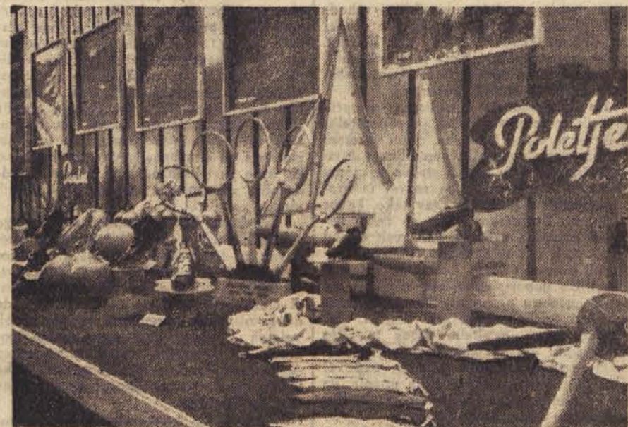
V lokalni proizvodnji se izdelujejo tudi kvalitetni fizikturni rekviziti