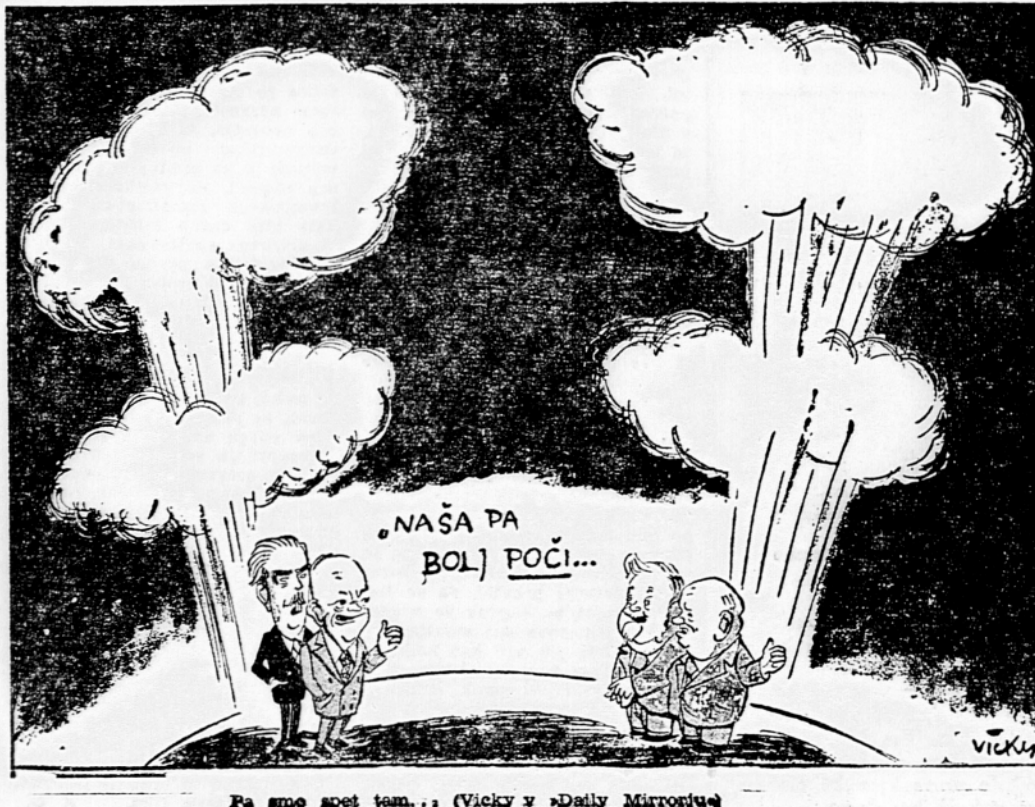
Pa sme spet tam... (Vicky v »Daily Mirrorju«)