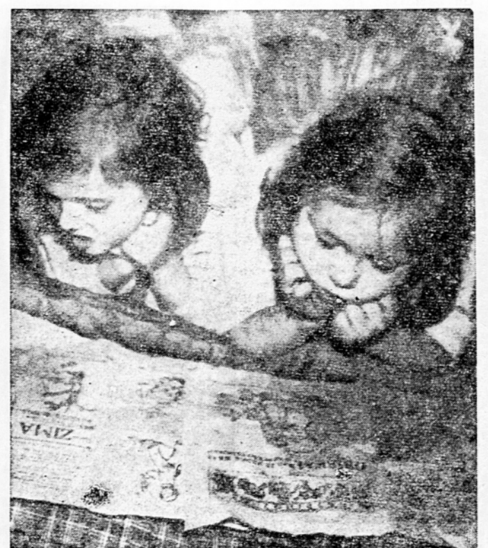
Tudi Tinka in Mojca radi prebirata knjige

In ko se je na večer svojega rojstnega dne odpravil Jurček v posteljo, je šepnil mami: »Veš, mama, reci Dedku Mrazu, naj mi ne prinese toliko igrač, le mnogo knjig bi rad...« V. K.