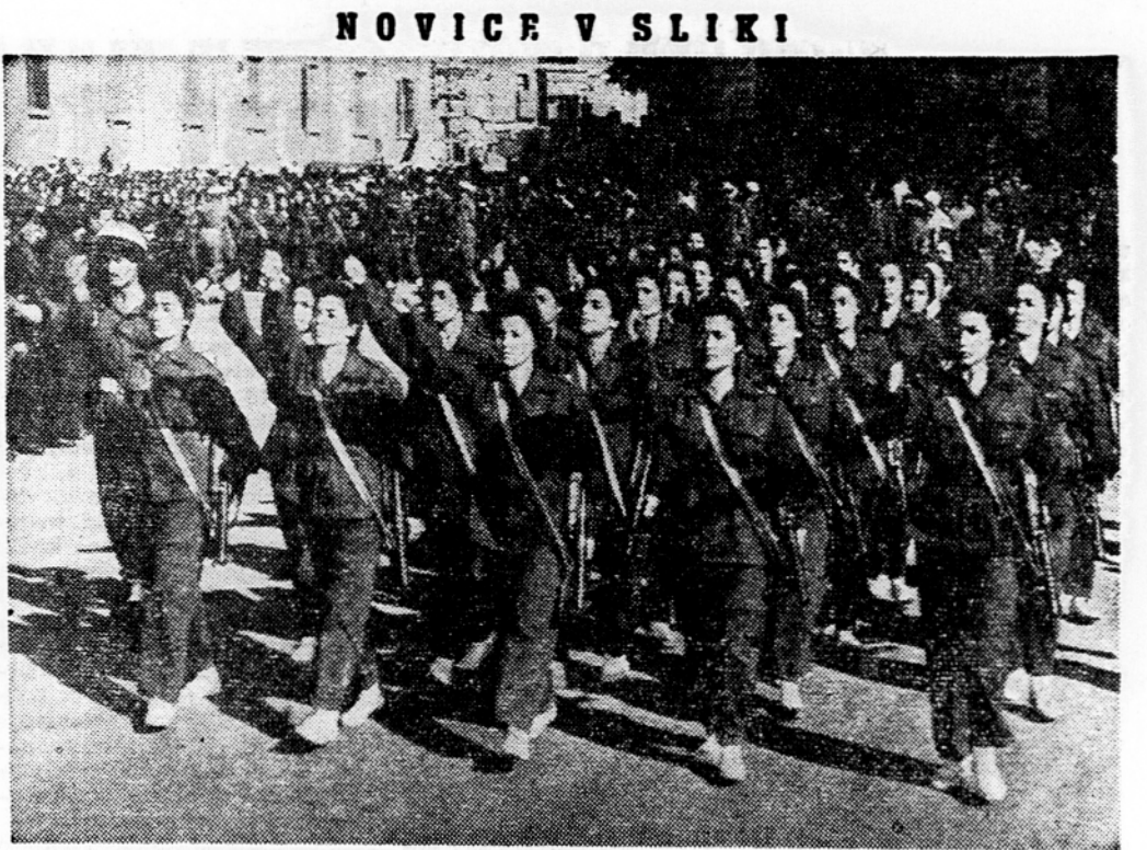
V Kajru so praznovali spominski dan ob obletnici bitke pri Sabhi. Na sliki: Na tisoče mladenčev in deklet nacionalne garde koraka proti mešaji Al Azhar, kjer je bila slovesnost.

Alžirska posvetovalna skupščina je sklenila s 67 glasovi proti 10 zahtevati od francoske vlade, da odloži parlamentarne volitve v štirih alžirskih okrožjih. V Parizu pravijo, da predpisuje francoska ustava istočasno parlamentarne volitve v vsej državi vseh štiri Alžir. Uradni krogi pa resno razmišljajo o predlogu alžirske posvetovalne skupščine, ker se boje, da bi alžirski nacionalisti 2. januarja bojkotirali volitve. Povečano delovanje oboroženih nacionalističnih enot dokazuje, da bodo francoske sile le težko uvedle popoln red, ki bi bil potreben za normalno glasovanje. Tudi sklep večine alžirskih poslancev v sedanji posvetovalni skupščini, da ne bodo kandidirali na volitvah, poslabšuje položaj. Generalni guverner Soustelle pa je izjavil, da bodo navzlic vsem izvedli volitve v vsem Alžiru. V ta namen so začeli v alžirskih okrožjih z naglo »očiščevalno akcijo«. V hudih bojih je samo te dni padlo sto ljudi.