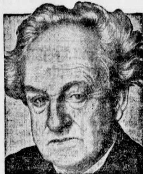
Gerhart Hauptmann, der bedeutendste Dramatiker der Gegenwart, feierte am 15. November seinen 65. Geburtstag.