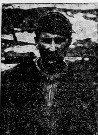
General Markos, vrhovni poveljnik grške demokratske armade