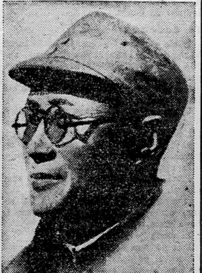
Liu Po Ceng, poveljnik kitajske ljudske armade, ki prodira med velokotoma Hoanghom (Rumena reka) in Jangeckiangom v osrednjo Kitajsko

Končno je moral tudi Čangkajšek na IV. plenarnem zasedanju osrednjega izvrševalnega odbora Kuomintanga dne 9. septembra 1947 priznati, da so postali