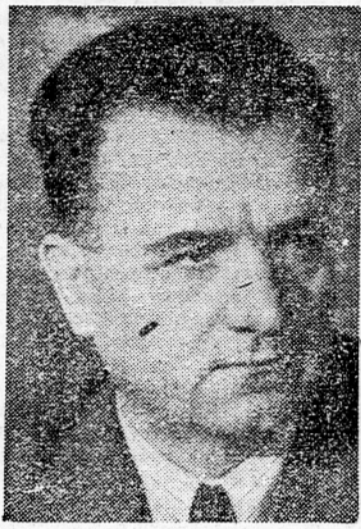
Klement Gottwald je sestavil novo češkoslovaško vlado

Praga, 26. febr. (Tanjug): Včeraj b 16.30 je sprejel predsednik Češkoslovaške republike dr. Edvard Beneš predsednika vlade Klementa Gottwalda, ki mu je predložil listo nove vlade. Na podlagi predloga predsednika vlade Gottwalda, je predsednik dr. Beneš imenoval nove ministre izpopolnjene in preosnovane vlade, ki je sestavljena takole: