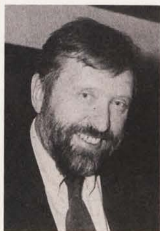
Slovenski zunanji ministar dr. Dimitrij Rupel.