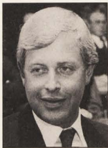
Namestnik deželnega glavarja dr. Christoph Zernatto (ÖVP).

Christof Zernatto je k temu dejal, da bi ob neuspehu pogajanj z Haiderjevimi svobodnjaki v zadevi novega kandidata za deželnega glavarja njegova stranka tak predlog celo podprla. SPÖ in ÖVP imata s 25 mandati za izglasovanje nezaupnice Haiderju potrebno dvotretjinsko večino. Haider sam pa ne more izglasovati novih volitev.