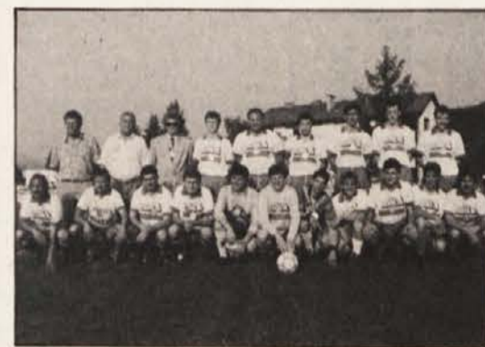
Prvak koroške nogometne lige: Pliberk