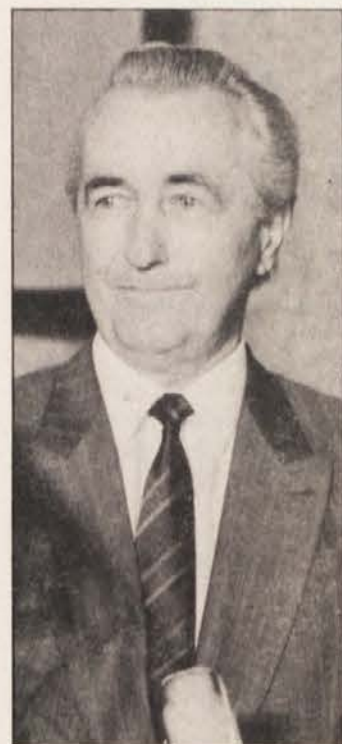
Premier Ante Marković

Po šestem krogu pogajanj predsednikov republik pred štirinajstimi dnevi v Sarajevu so se pretekli teden v Splitu sestali Slobodan Milošević, Franjo Tuđman in Alija Izetbegović. Tema sestanka je bilo urejanje mednacional-