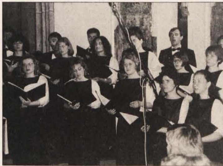
Člani APZ Tone Tomšič so peli v kapelski cerkvi.