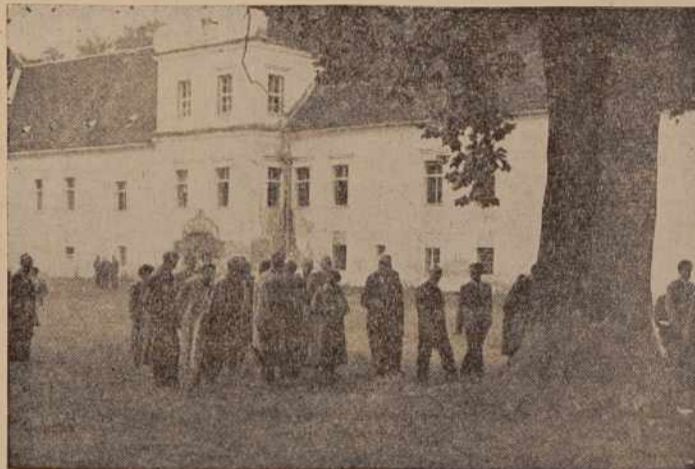
Tudi v rakičanskem gaju so se ustavili. Razen grajskega postopja je napravilo nanje ugoden vtis tudi staro, mogočno drevo divjega kostanja.