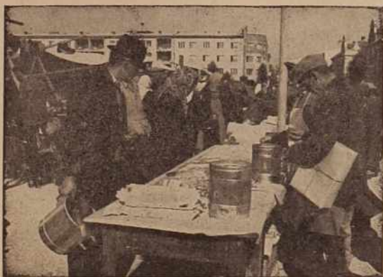
»Terezijine sejem v M. Soboti — bil je v ponedeljek, vendar pa ni tako uspel kot prejšnja leta. Morda pa ljudje ne dajo več toliko na te prireditve?«

je zrasel kot goba po dežju. Visel je že takorekoč sv zrakue in vzbujal strah v ozračju in vaščanom, ki so morali čez Gornji brod. Tudi za popravilo mostu se je zavezal vaški odbor SZDL. Beltinska občina je