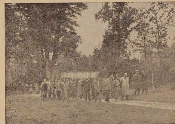
Po zborovanju so se udeleženci podali po pokrajini. Obiskali so številne kraje in si ogledali kulturno-zgodovinske znamenitosti. Na sliki jih vidimo, ko se sprehajajo po beltinskem parku.