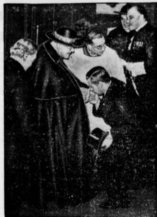
Westminstrski nadškof Hinsley, ki je bil v Rimu imenovan za kardinala, se je iz Rima vrnil v London. Na londonski postaji ga je čakal vojvoda Norfolkski, goreč katoličan in najvišji angleški plemič, ki je kardinalu poljubil kardinalov prstan na roki.

Tako se v Rusiji skriva vera in tako se za njo ljudje bore.