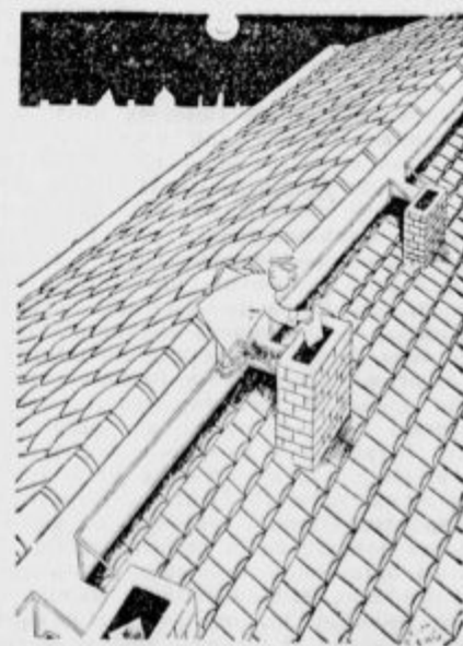
Če pismonošo po noči v spanju luna nosi.

Med povzdigovanjem pa je slepi pianist nenkrat zaznal v svojih očeh svetlobni žarek, nakar je kmalu vse videl in je bil docela ozdravljen. Kakor trde, ozdravljeni nikdar ni imel kakih halucinacij. Sam je prepričan, da je čudežno ozdravel. Sam je izgovoril dobesedno tele besede: »Ta čudež je moje duševno življenje hudo pretresel. Potrudil se bom biti sprejet v katoliško cerkev. Vsem bom pripovedoval, da sem ozdravljen po božjem čudežu.«