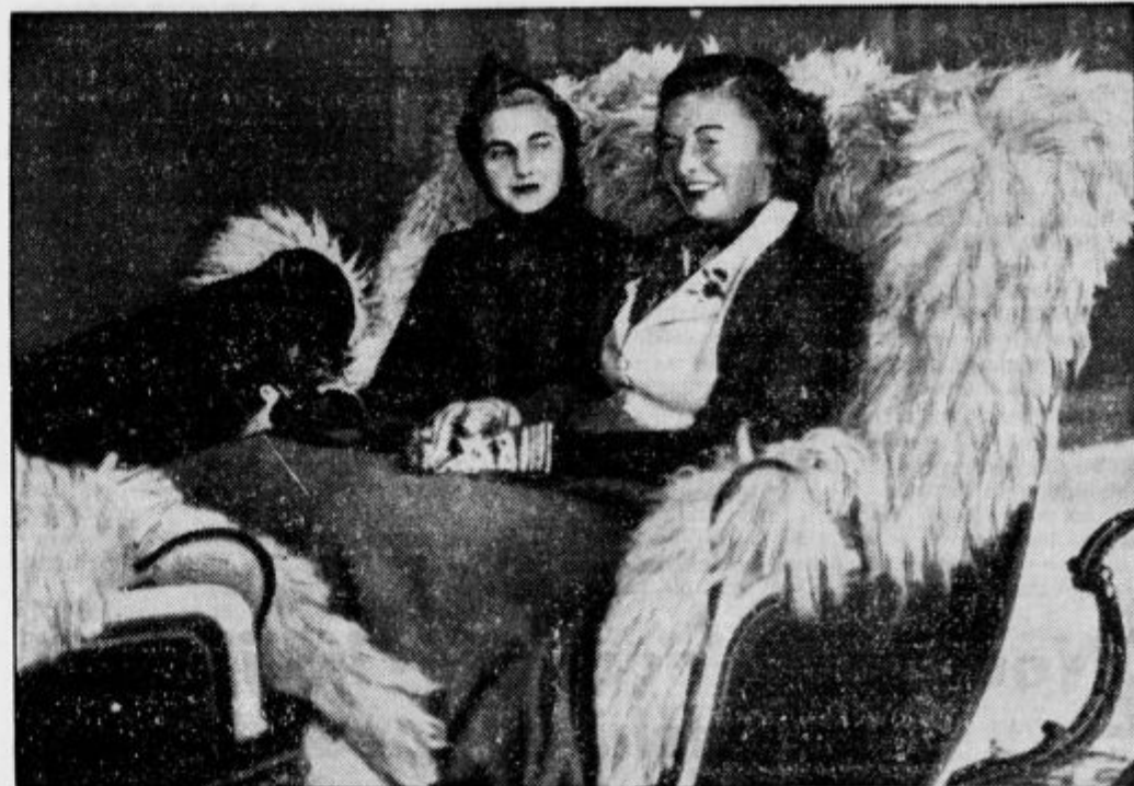
Najbogatejša ženska Severne Amerike je grofica Barbara Haugwitz-Reventlow, rojena Hutton (na levi). Podedovala je silne milijone. Zdaj pa je odložila ameriško državljanstvo in postala Danka, ker je doma v Ameriki dobivala vedno izsiljevalna in grozilna pisma od roparjev, ki so ji grozili, da ji bodo odvedli otroke, če jim ne plača toliko in toliko. Na sliki jo vidimo, ko se na saneh vozi po Svici.

teri se je zavezal, da bo za toliko in toliko dolarjev popisal svoje spomine. To je višek! Hujšega udarca bi ne bil mogel zadati svojim nekdanjim stanovskim tovarišem in svoji žlahti.