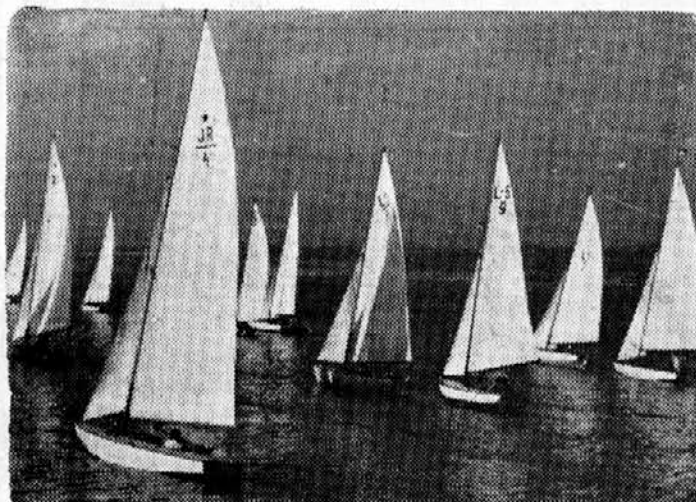
Prizor z olimpijskih regat v Neaplju

Američani so v Rimu nabrali 6 zlatih kolajni manj kot v Helsinkih (34:40), in to zaradi tega, ker so nazadovovali v lahki atletiki (15-16-12), v boksu (5- 2-3), jadrnanju (2-1-1), veslanju (3-3-1) in dviganju