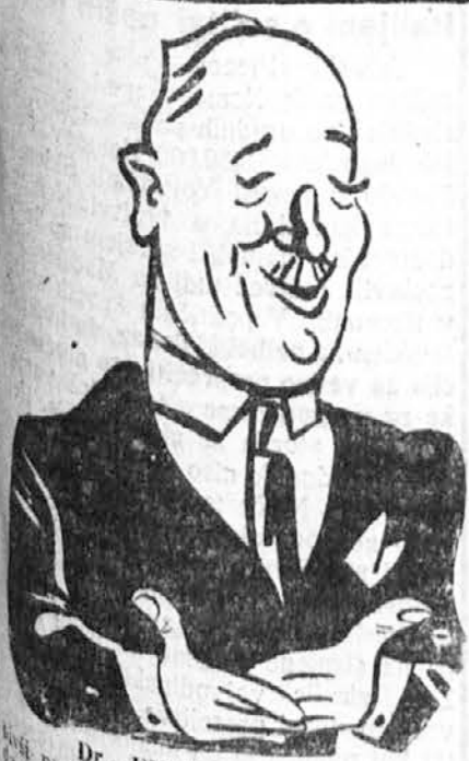
DR. EDVARD BENES

OSLO, 6. nov. Havas. Tovor, ki je bil na parniku »City of Flint«, so izkricali in prodali v Bergenu.