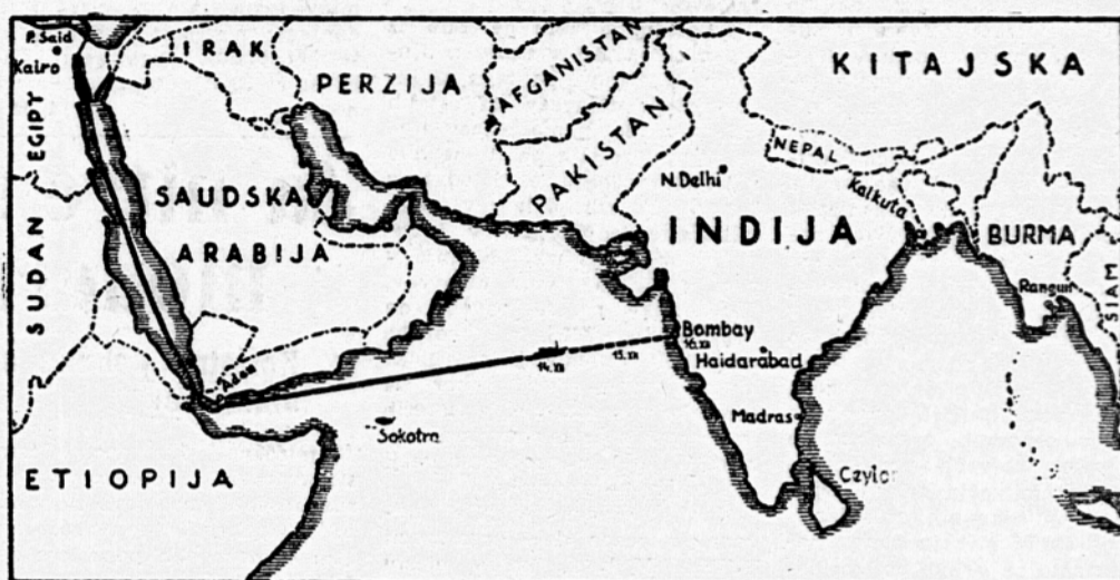
Pot predsednika Tita v Indijo